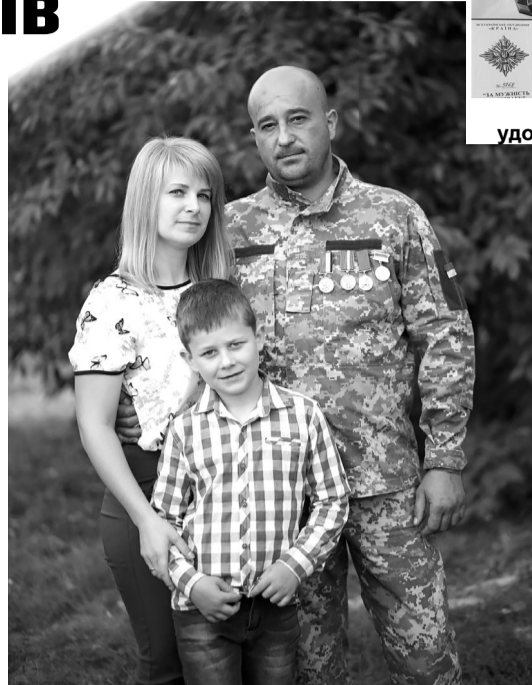
Щасливі миті, коли сім'я була разом.