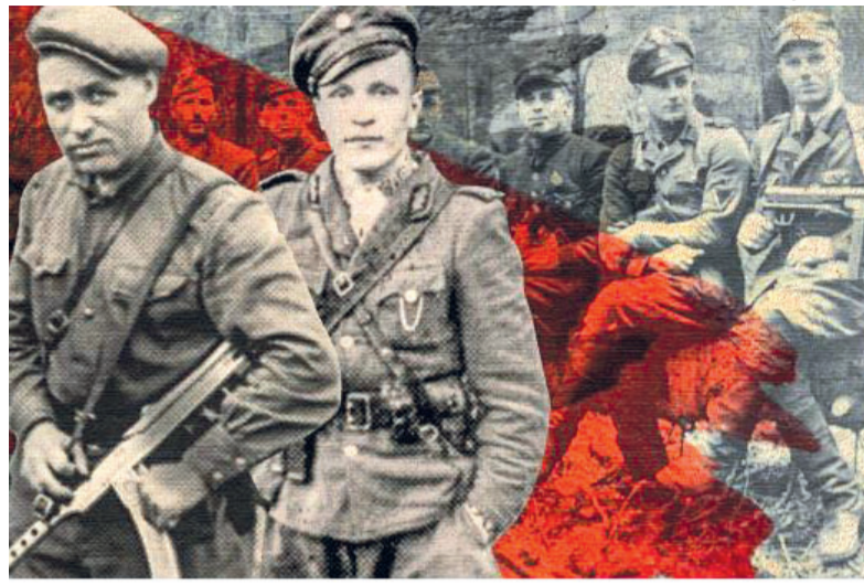
Подвиг Героїв УПА надихає сьогодні наших захисників у війні з росією.