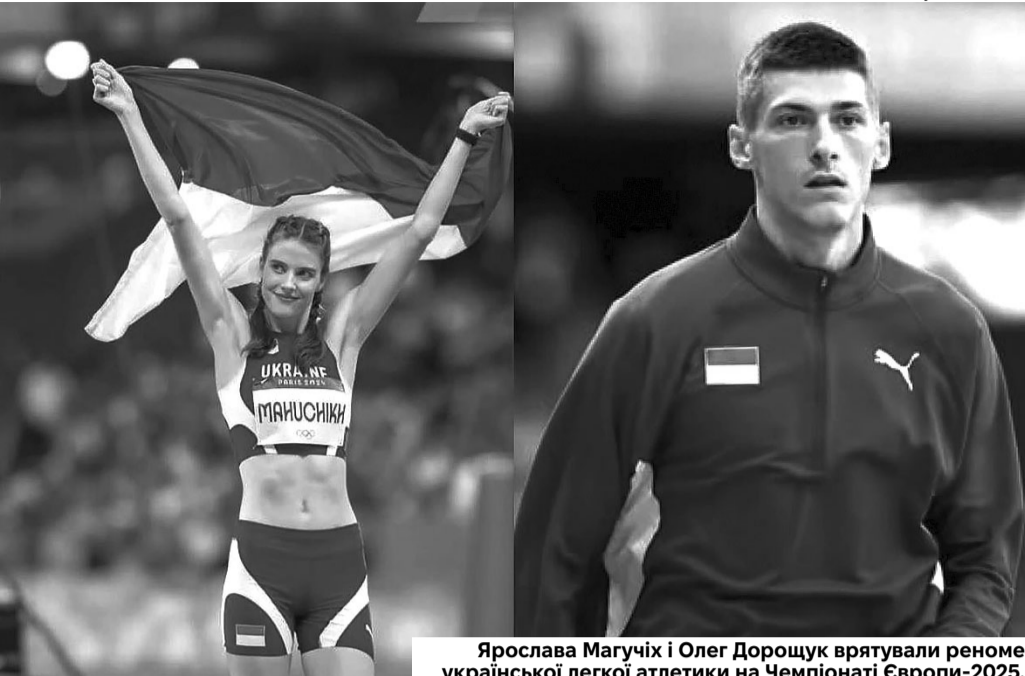
Ярослава Магучіх і Олег Дорошук врятували реноме української легкої атлетики на Чемпіонаті Європи-2025.