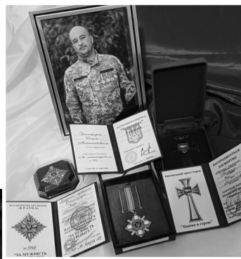
Волинський захисник удостоєний багатьох нагород.

Йому боляче, бо бачила в його очах смуток. А його ніжне світле звернення до мене – «Анжик» – навіки буде жити у моєму серці».