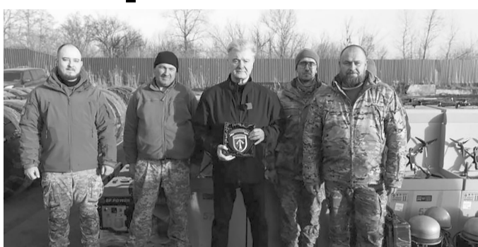
«Нас зустрічають добрі друзі – військові штурмових та аеромобільних бригад, стрілецького та батальйону БПЛА, десантники та бійці тероборони».

«421-й окремих батальйон БПЛА без FPV-шок та «Мавіків» взагалі як без рук. Тому, як тільки в них закінчуються запаси, ми веземо наступну партію. Цього разу –