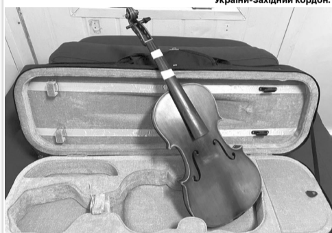
Під час огляду інспектори знайшли в салоні авто унікальну цінну скрипку.