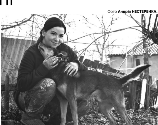
«Я знала куди йду, знала, що це війна, але, разом із тим, хотілося бути корисною».

«Мій брат служить в 14-ій ОМБр. Я планувала йти у князівську бригаду кухарем, але з початком повномасштабного вторгнення все перебралося. Та