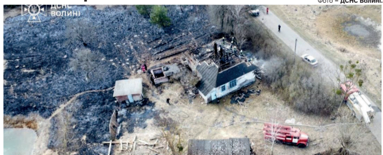
Ось як тепер виглядає обійстя господаря...