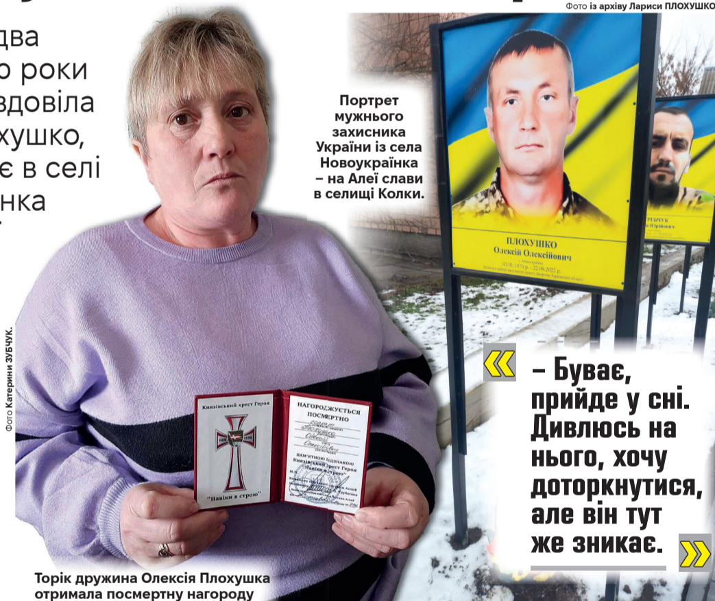
Портрет мужнього захисника України із села Новоукраїнка – на Алеї слави в селищі Колки.