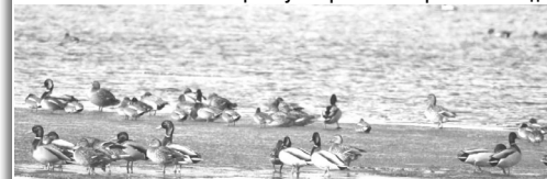
Фото із фейсбук-сторінки НПП «Прип'ять – Стохід».