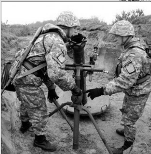
Такої зброї тепер бояться ті, хто з неї стріляє.

Петро Порошенко доручив міністру оборони генералу Степанові Полтораку та начальнику Генерального штабу генералу Вікторові Муженку до завершення розслідування не використовувати на навчаннях міномети «Молот», що могли стати причиною трагедії