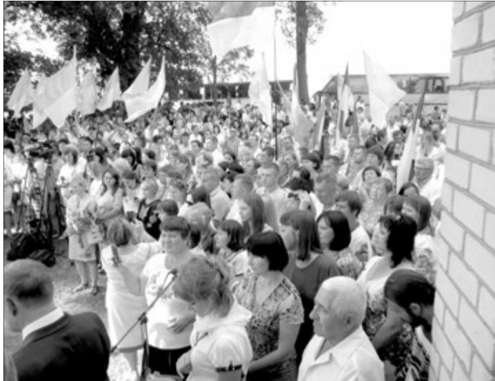
Вшанувати пам'ять загиблих українців у Гончий Брід приїхало кілька сотень людей.