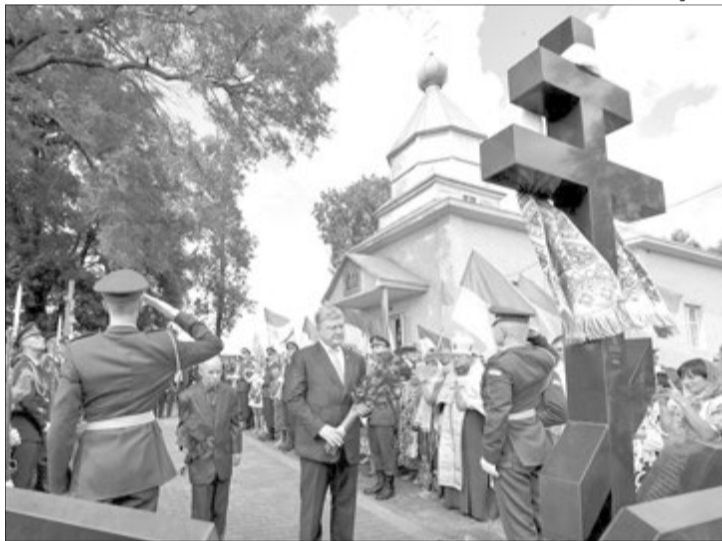
Квіти від глави держави та очевидця тих подій — жертвам трагедії.

За кілька хвилин до 16.30 — запланований офіційний початок церемонії — в небі з'явилось 3 гелікоптери, аж із дерев біля церкви посипалося листя. І ось нарешті у викладений бруківкою двір храму входить Петро Порошенко, за ним — голова Волинської облдержадміністрації Олександр Савченко, голова Ковельської РДА Віктор Козак, народний депутат Ігор Лапін, аграрій та обласний депутат Валерій Діброва. Чомусь не було