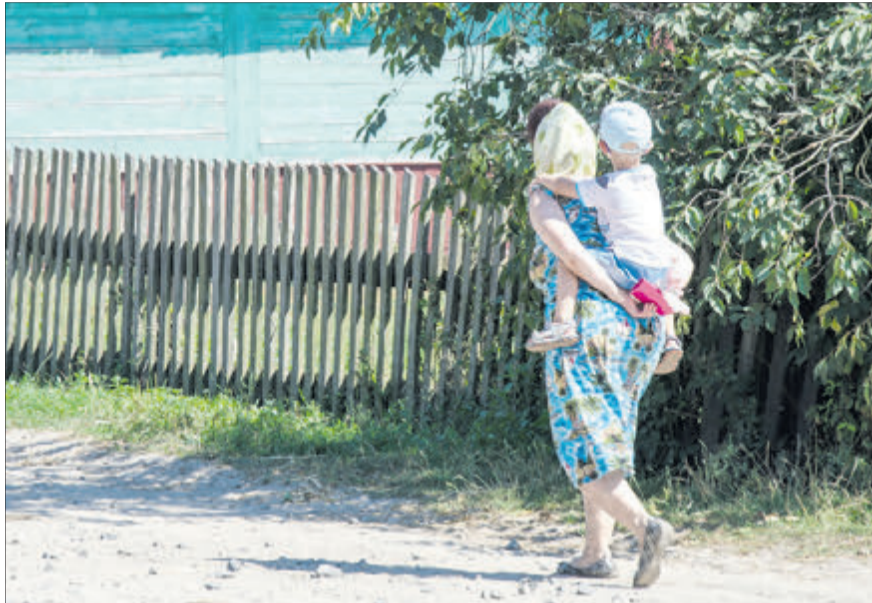
Називають це по-різному: взяти «на корабля», «на краба» і традиційно – «на барана».

Зовсім не важливо, де зроблене це фото. Адже бабусі всюди однакові. І до внуків ставляться вони по-особливому. Менше сварять, ніж батьки, та більше пестять. Сам це добре знаю. Тож сил і здоров'я вам, рідненькі! А коли життя й підкине вам тягар на плечі, то нехай він буде лише ось таким!