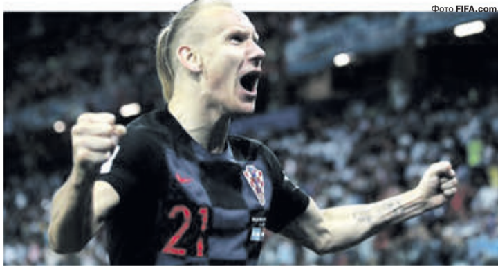
«ФІФА попередила Домагой Віду: після слів «Слава Україні!» треба казати «Героям слава!», а не «Давай-давай», — жартують нині в інтернеті».

А якщо ще й додати до цього цілу хуру чутих звідусіль компліментів латиноамериканцям щодо збалансованості їхнього складу та наявності в ньому «зірково» розхваленого Неймара, то