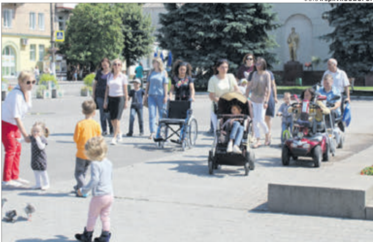
Люди на візках важко долали психологічні і фізичні бар'єри.