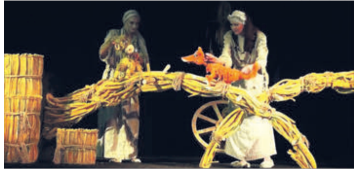
«Солом'яний бичок» визнаний найкращою виставою у п'ятьох всеукраїнських номінаціях.