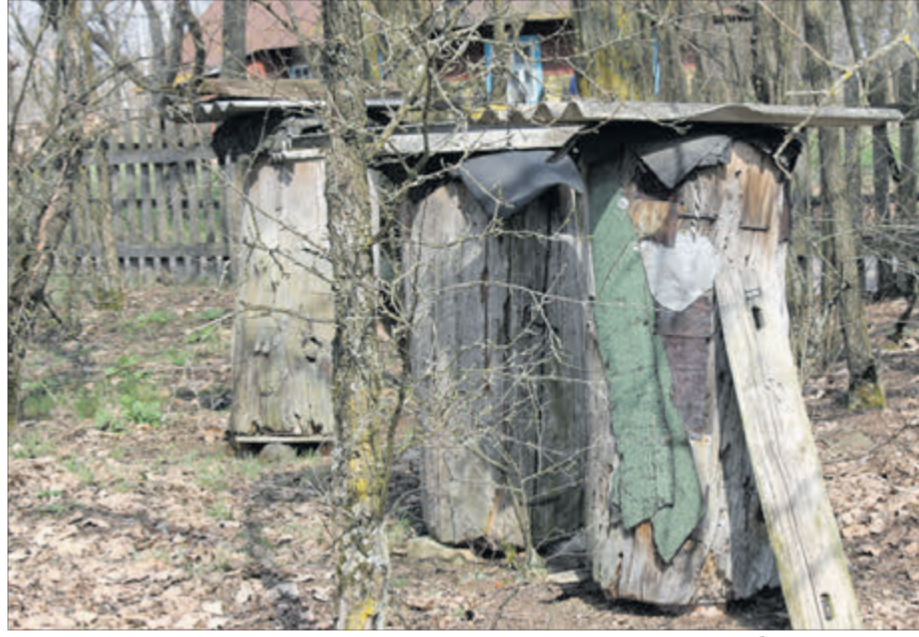
Цим вуликам уже більше ста років.