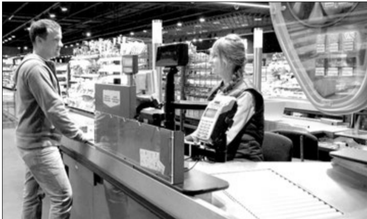
Кожен може долучитися до програми «Гарантія свіжості».

«Наша компанія в особі кожного відвідувача крамниць «АТБ» вбачає не лише пере-