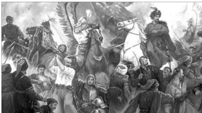
«Битва під Берестечком». Художник Артур Орльонов.

Хід бою відомий: після обопільних атак поляки сильно вдарили по татарах і ті втекли, тим самим оголивши лівий фланг. Згідно з офіційною версією Богдан Хмельницький кинувся вертати союзників. Дивно лише, що друга людина у козацькому війську генеральний писар Іван Виговський поїхав разом із гетьманом, а не залишився