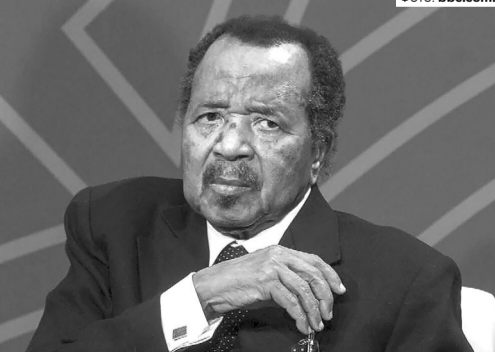
Поль Бія ще піднімає руку, тож і президентом може бути!