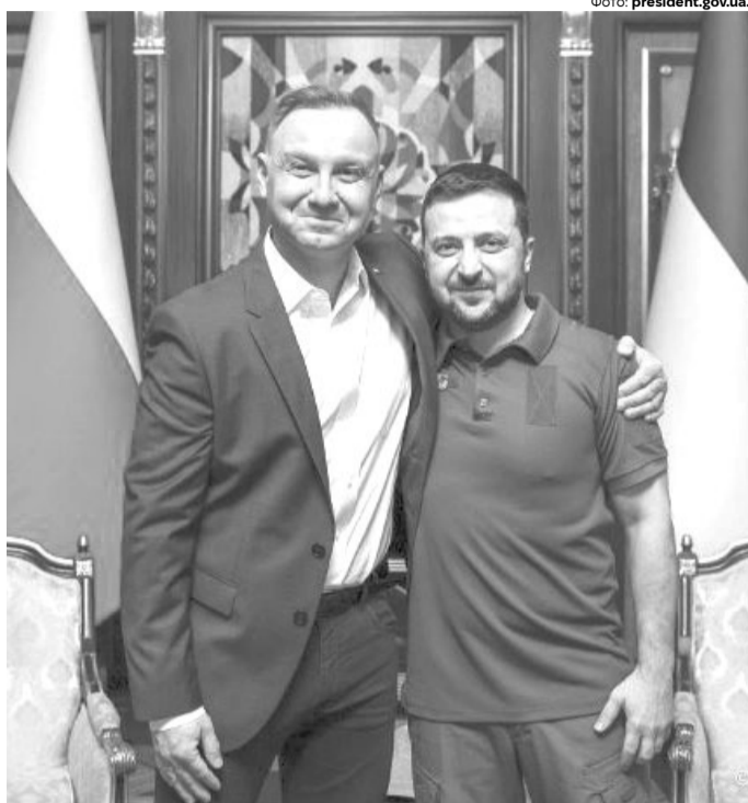
Анджей Дуда прийшов з прощальним вояжем на посту президента Польщі до Києва, пообнімався із Зеленським, а потім та-а-а-ке заявив...

«Я думаю, що як українці, так і наші союзники просто вважають, що аеропорт у Жешуві (Ряшеві – через нього йде військова допомога Україні. – Ред.) та наші автомагістралі належать їм, ніби це – їхнє. Але це – не їхнє. Це – наше. Тому, якщо комусь щось не подобається, то закриваємо – і до побачення. Так, робимо ремонт. Закриваємо аеропорт у Жешуві, а ви доставляйте в Україну морем, повітрям, не знаю, скидайте на парашутах. Вигадуйте. Вигадуйте, якщо вважаєте, що ми вам не потрібні», – зробив дивну заяву Дуда.