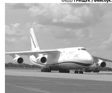
«Руслане», знову чекаємо тебе в небі України!

Нагадаємо, 11 липня у небі над Києвом помітили літак Ан-124-100 Руслан. І це було дивом, адже небо над Україною закрито для польотів цивільних літаків з