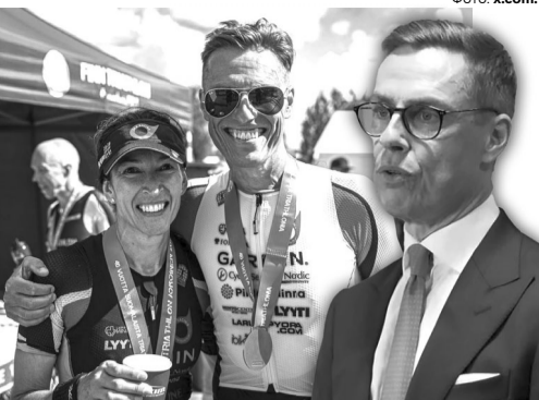
Свою особу Александр Стубб розкрив лише після фінішу.