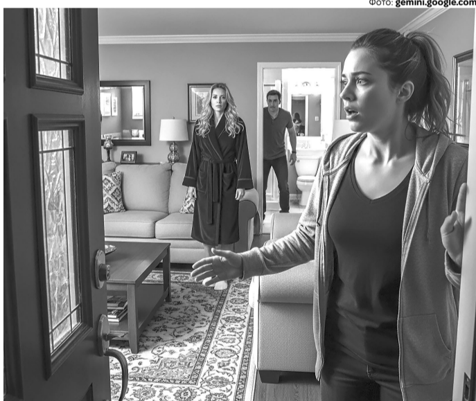
«Приїхала я додому, відчиняю двері – й мало не отетеріла...»

Приїхала я додому, відчиняю двері – й мало не отетеріла від того, що нашим будинком у халатку, добре хоч не в моєму, хизується дівчина, якої тут ну ні за яких обставин бути не повинно.