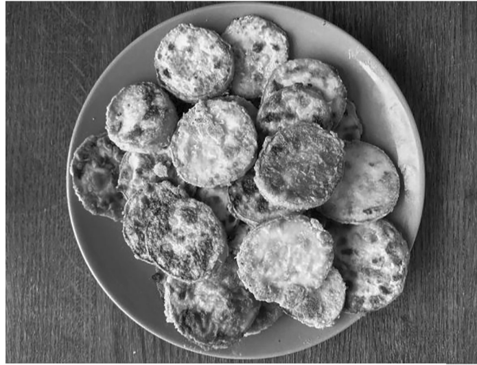
Цей простий секрет соковитої закуски стане вашою фішкою.

ти занадто м'якими або пересоленими від замочування.