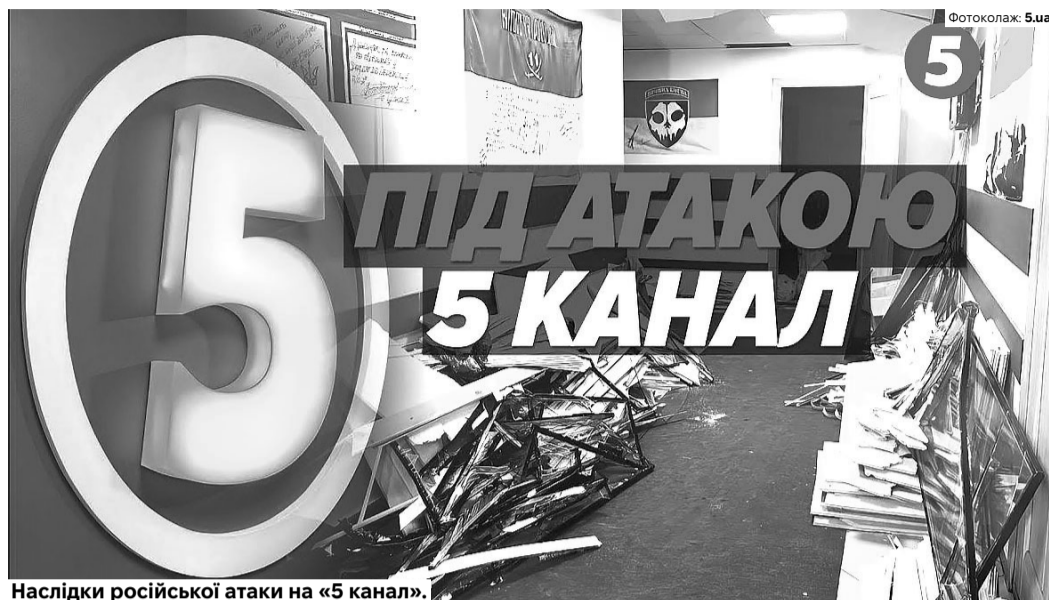
Наслідки російської атаки на «5 канал».

Українці вимагають повернути цифровий ефір для незаконно відключених телеканалів