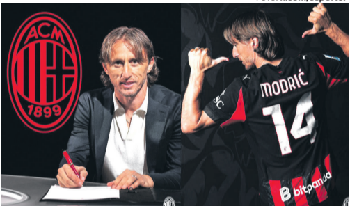
У «Мілані» Лука Модрич буде виступати під 14-м ігровим номером.