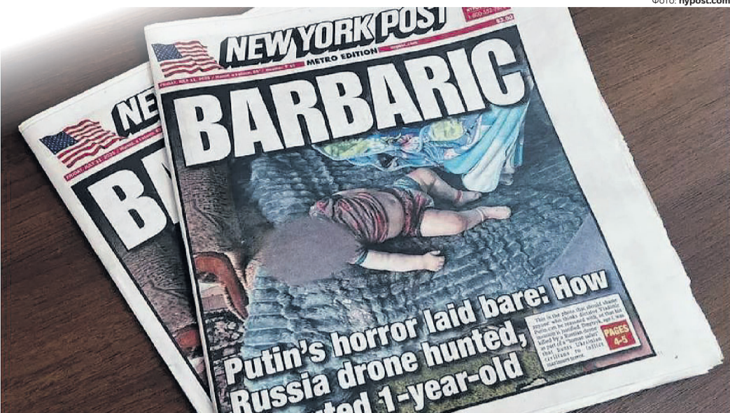
«Москва перетворює Херсон на «зону людського сафари», – так «Нью-Йорк Пост» підписала цей знімок.

Видання The New York Post, яке називають «улюбленим президента США і всіх республіканців», на першій шпальті оприлюднило фото вбитого військами РФ українського однорічного хлопчика