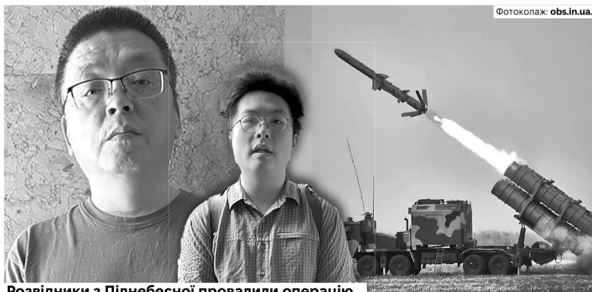
Розвідники з Піднебесної провалили операцію...

Як встановило розслідування, один із китайських шпигунів – 24-літній екстудент одного з київських техніч-