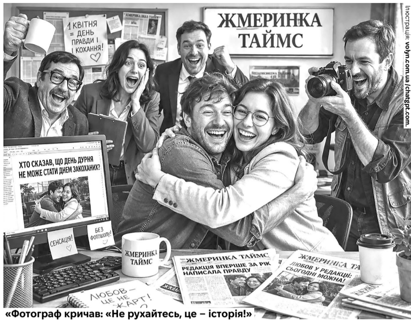
«Фотограф кричав: «Не рухайтесь, це – історія!»