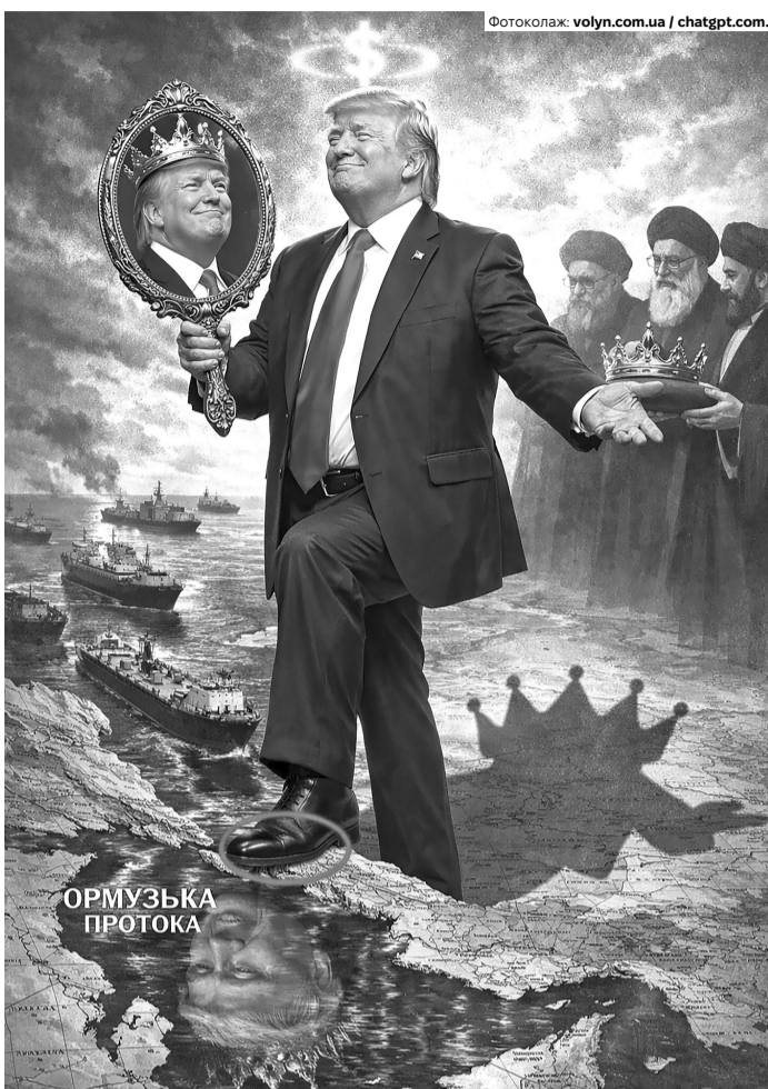
На форумі у Маямі Дональд Трамп наголосив, що якщо США гарантують безпеку судноплавства через Ормузьку протоку, то її назву слід змінити на честь США або його самого. Пригадуєте перейменування ним Мексиканської затоки на Американську?

Тут варто зазначити, що історія американської політики знала чимало президентів, чії слова викликали здивування чи