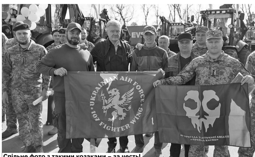
Спільне фото з такими козаками – за честь!

«Ці екскаватори копатимуть окопи, будуватимуть капоніри для