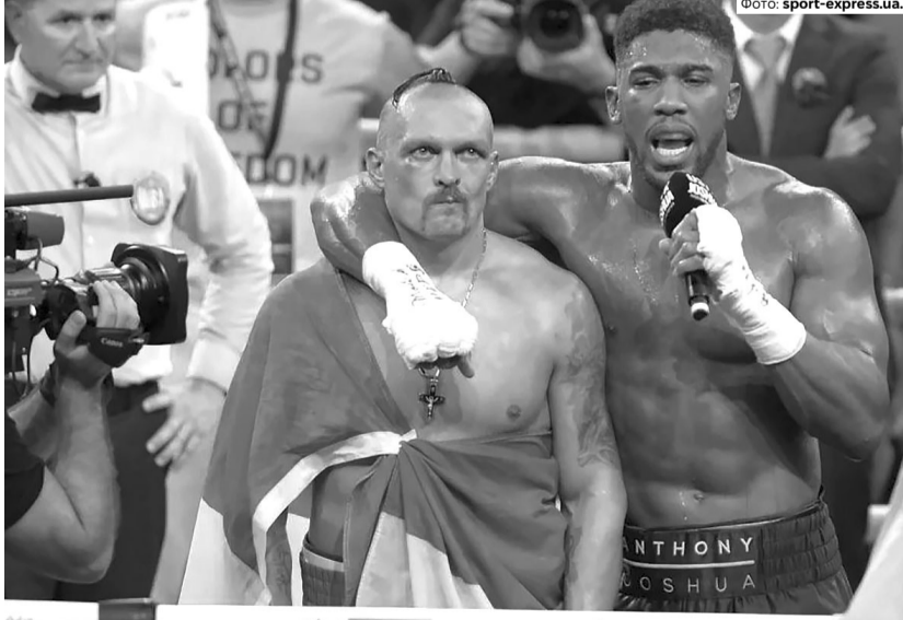
Після перемоги над Джошуа у 2022 році Усик присвятив тріумф Україні та ЗСУ.

«Коли почалася війна, я сказав: «Я припиняю боксувати. Я йду захищати свою країну». Десь місяць я був в теробороні, але потім поїхав до Львова, ми були в лікарні. Один чоловік із Криму, з мого міста сказав: «Алексе, будь ласка,