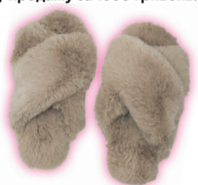
Як вам такі капці?

До речі, Михайло Поплавський контролював