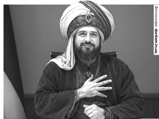
Ось так бачили Андрія Єрмака в ролі Алі-Баби. А що триматиме в руках Єрмак-«Хірург»?

Голова підрозділу детективів Національного антикорупційного бюро Олександр Абакумов розповів, що колишній голова Офісу Президента Андрій Єрмак фігурує на «плівках Міндіча» під псевдонімом Хірург. Детектив зазначив, що не може коментувати інформацію щодо того, чи стосувалась справа «Мідас» Єрмака, однак повідомив, що «є окремі псевдоніми, які можуть бути пов'язані з цією особою». Про це Абакумов розповів в інтерв'ю ведучій каналу