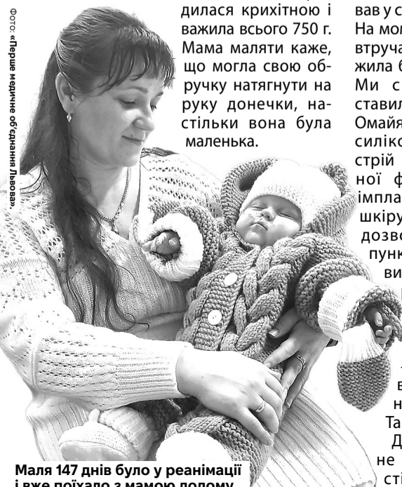
Маля 147 днів було у реанімації і вже поїхало з мамою додому.

Після 147 днів у реанімації та 9 місяців боротьби, дівчинку з вагою 6,2 кг виписали з лікарні. За результатами електроенцефалографії в неї не виявлено судом, що є рідкістю серед таких передчасно народжених малюків. Вона дихає самостійно, їсть із пляшечки, активно агукає, реагує на батьків. Попереду на дитину чекають регулярні огляди та курси реабілітації.