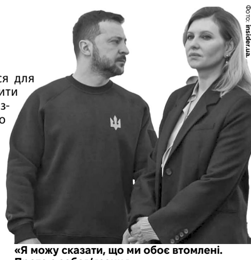
«Я можу сказати, що ми обоє втомлені. Проте є зобов'язання».

Хоча під час обрання президентом України у 2019 році Володимир Зеленський запевняв, що йде тільки на один президентський термін.