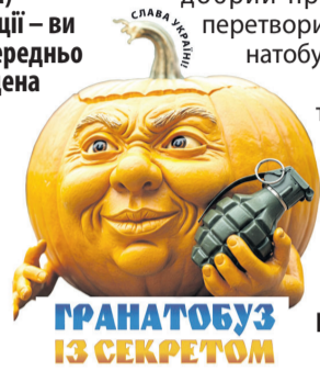
ГРАНАТОБУЗ ІЗ СЕКРЕТОМ

туальної вікторини нагадує «чорний ящик» із популярної гри «Що? Де? Коли?». Тільки предмет чи зображення людини ми ховаємо в гарбуз (від початку повномасштабного вторгнення нелюдів-москалів наш добрий-предобрий гарбуз перетворився у грізний гранатобуз).