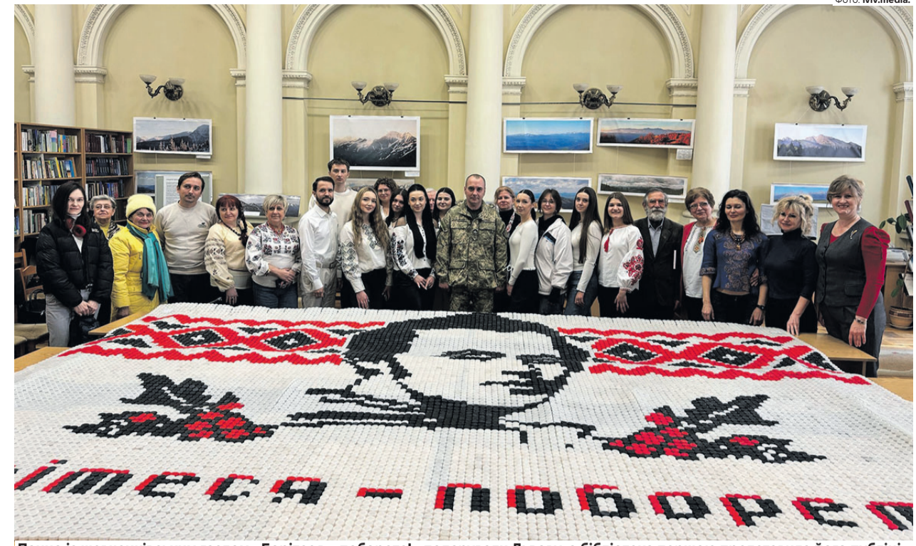
Панно із шевченківським гаслом «Борітеся – поборе!» подарували Львову, а бібліотека першою представила його публіці.