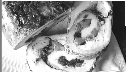
Такий рулет стане вашою фішкою на свято Воскресіння Господнього.