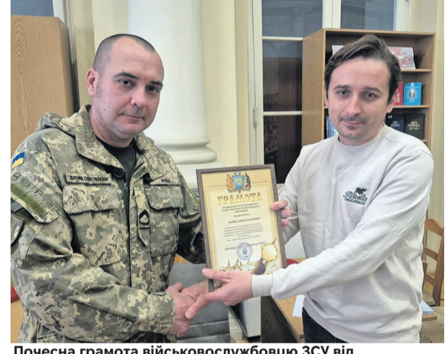
Почесна грамота військовослужбовцю ЗСУ від Департаменту екології та природних ресурсів Львівської обласної державної адміністрації.

Для автора цей процес став способом підтримати психоемоційний стан під час війни. Панно подарували