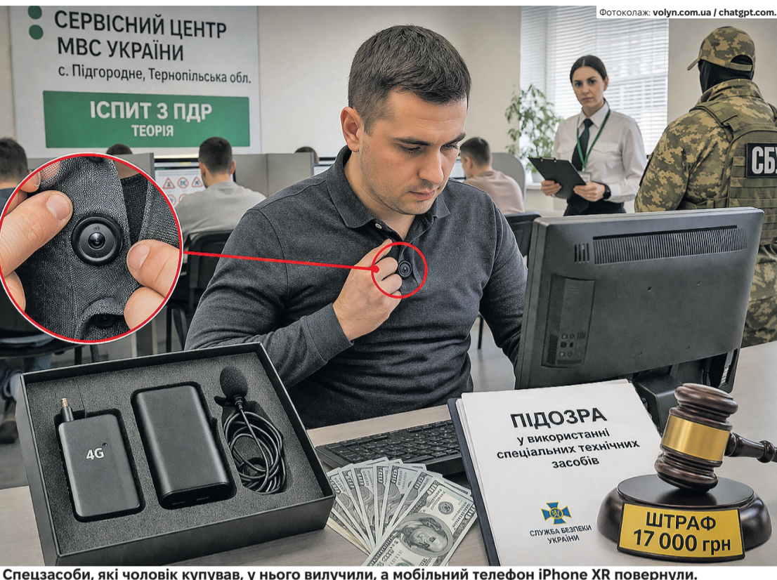
Спецзасоби, які чоловік купував, у нього вилучили, а мобільний телефон iPhone XR повернули.