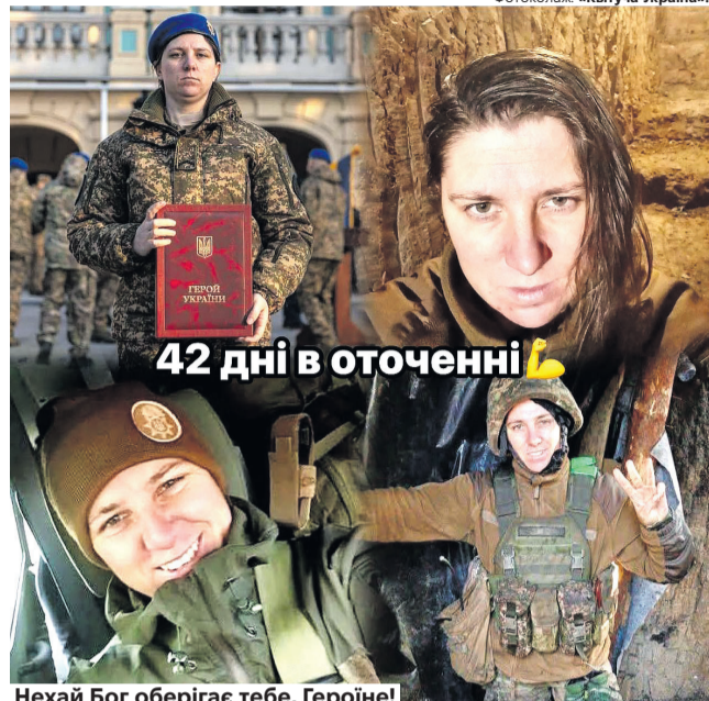
Фотоколаж: «Квітуча Україна».