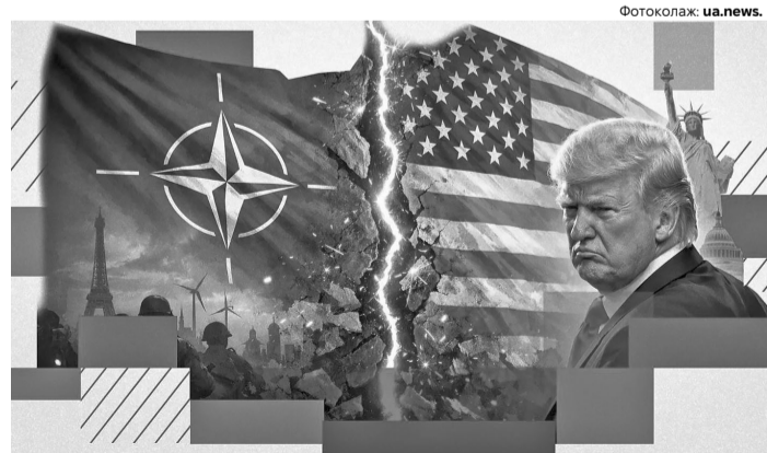
«Бувай, бувай!» – Трамп погрожує виходом із НАТО. Що ж, мрія путіна починає збуватися...

І пов'язаний він насамперед із підривом економічного потенціалу росії та ударами по її військово-промисловому комплексі. Якщо у росії не буде ресурсів для війни – не буде й самої війни. Так, взаємовигідне економічне співробітництво з нею в такому разі стане неможливим. Але натомість з'явиться шанс підготуватися до нової війни, яка може розпочатися знову – тоді, коли росія відновить свій економічний потенціал і буде готова до нового стрибка.