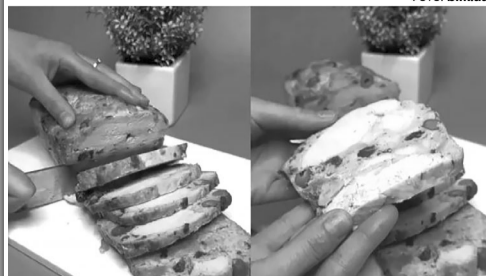
Один вигляд уже апетитний...