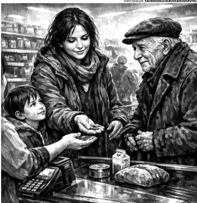
«Хай Господь тебе береже, дитино. Ти й не знаєш, як ти мене зараз виручила.»