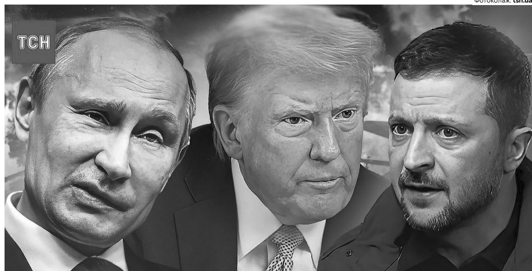
Кривопивця путін не може дочекатися, коли ж уже «любий Донні» перетисне Зеленського.