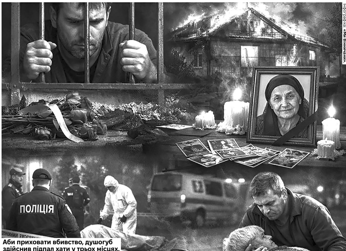
Аби приховати вбивство, дугогуб здійснив підпал хати у трьох місцях.

Трагедія сталася 13 червня 2025 року. Чоловік вирішив провідати жінку, з якою перебував у дружніх стосунках (вона навіть називала його «сином»). Він винайняв таксі, купив пакет продуктів та букет квітів. Але за столом під час вживання алкоголю між ними спалахнув конфлікт. За словами обвинуваченого, жінка почала нецензурно висловлюватися на його адресу та адресу його матері. Ситуацію загострило те, що загибла займалася ворожінням.