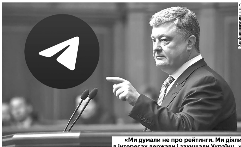
«Ми думали не про рейтинги. Ми діяли в інтересах держави і захищали Україну...»

П'ятий президент ще раз звернув увагу на цю проблему після нещодавнього рішення Європейського суду з прав людини, який нарешті визнав законним блокування ще у 2017 році російських «ВКонтакте», «Однокласнікі», mail.ru, «Яндекс» та інших інструментів гібридної війни кремля