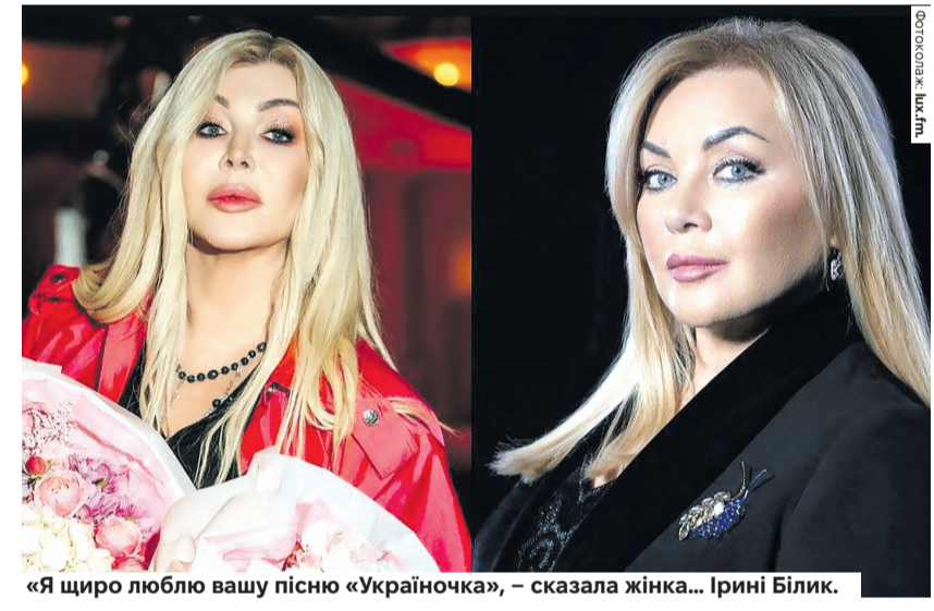
«Я щиро люблю вашу пісню «Україночка», – сказала жінка... Ірині Білик.