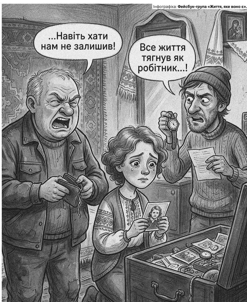
Він виховав силу в своїх дітях.