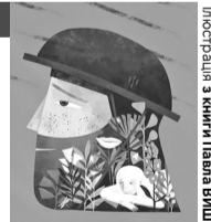
Ілюстрація з мистецтва Павла Вишебаби.

(17 травня 2022, Мар'їнський район Донецької області).