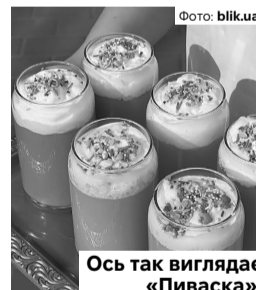
Ось так виглядає «Пиваска».

Напій позиціонується як святковий експеримент до Великодня. Собою він являє цитрусове нефільтроване пиво з ніжним солодким смаком, який доповнений кремовою текстурою лікеру та фруктовими нотами груші. Зверху його прикрашає піна і цукрова посипка. Вартість одного келиха – 185 гривень. Цікаво, як церква поставиться до такої фішки?