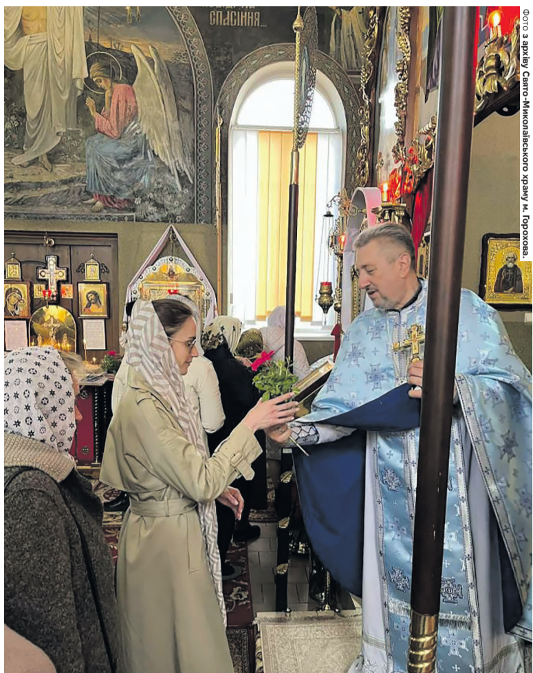
Подаровані в благодатну хвилину тендітні петунії швидко розростуться великими букетами для горохівських господинь.

...Неймовірно зворушливо було бачити, як із подвір'я храму жінки та дівчата йшли додому,