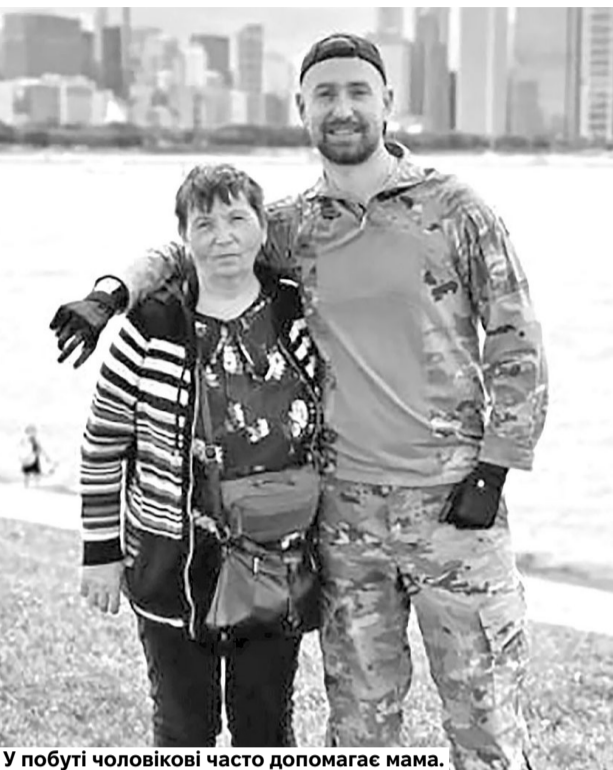
У побуті чоловікові часто допомагає мама.