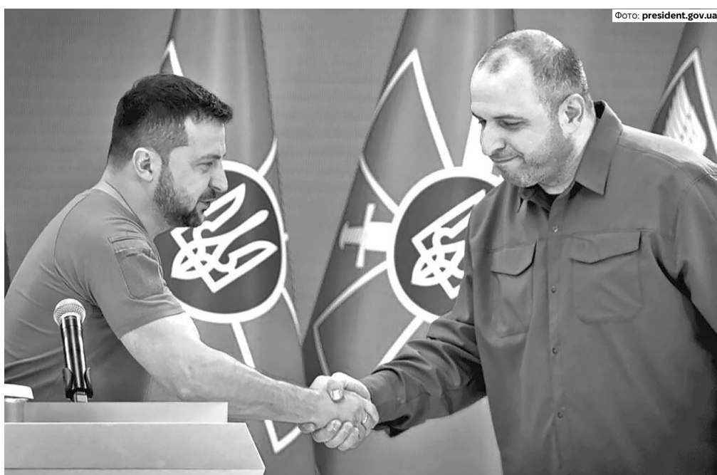
Політологи кажуть, що втрата Умерова стане серйозним викликом для Зеленського.