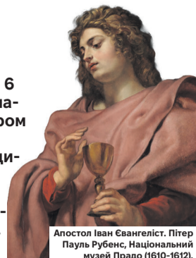
Апостол Іван Євангеліст. Пітер Пауль Рубенс, Національний музей Прадо (1610-1612).

(Апостол Іван БОГОСЛОВ (близько 6 року н. е. – 100–101 року н. е.), якого називають «Апостолом любові», є автором одного з Євангелій, трьох Послань та Книги Одкровення (Апокаліпсиса). Єдиний з апостолів, хто помер власною природною смертю, попри численні спроби його стратити (наприклад, переказ про котел із киплячою оливою, з якого він вийшов неушкодженим).