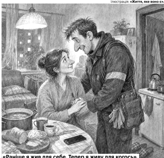
«Раніше я жив для себе. Тепер я живу для когось».

Працював я електриком, заробляв непогано. Після зміни – бари, дискотеки, іменини друзів. Траплялося, проводив ніч із жінкою, а наступного дня просто зникав із її горизонту. Не тому, що був підлою людиною, а тому, що не шукав нічого справжнього. Завжди казав: «Око-ви сімейного життя – то не для мене».