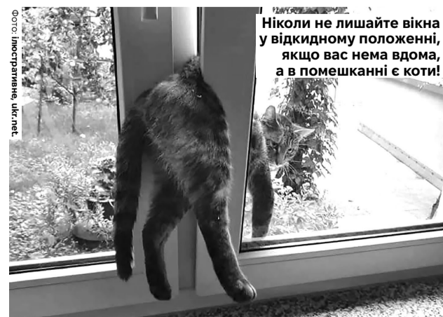
Ніколи не лишайте вікна у відкидному положенні, якщо вас нема вдома, а в помешканні є коті!