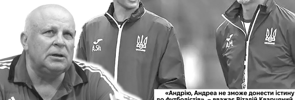
«Андрію, Андреа не зможе донести істину до футболістів», – вважає Віталій Кварцяний.

«Я не хочу, щоб іноземець очолював збірну України», – вважає авторитетний футбольний спеціаліст із Луцька