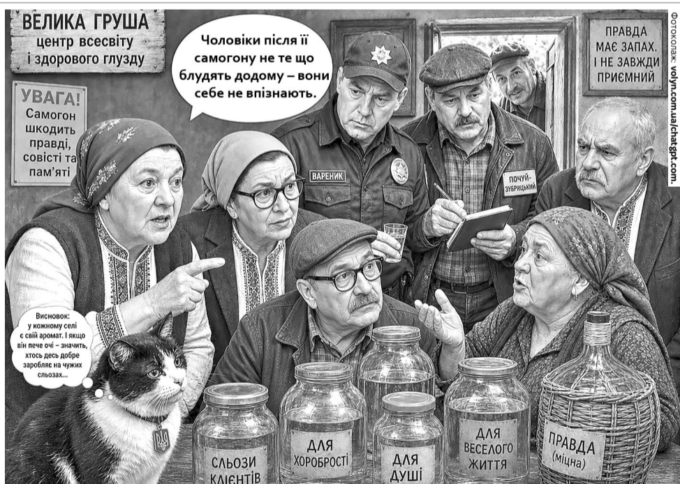
– Слухай, Нимидоро Панасівно, а ти не думала, що твоє «по сто грам» комусь життя ламає?

повіла Трандичиха. – Без ГМО і без совісті.