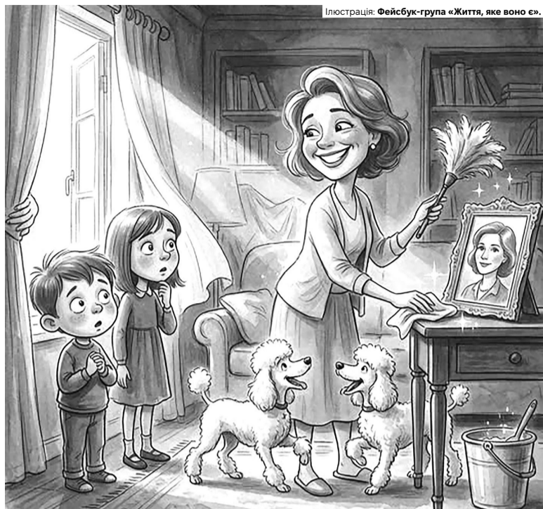
Коли вона зупинилася перед портретом нашої покійної мами у вітальні, я був певний: зараз вона його зніме. Але – ні.

дня, сам того не знаючи, я змінив свій життєвий курс.