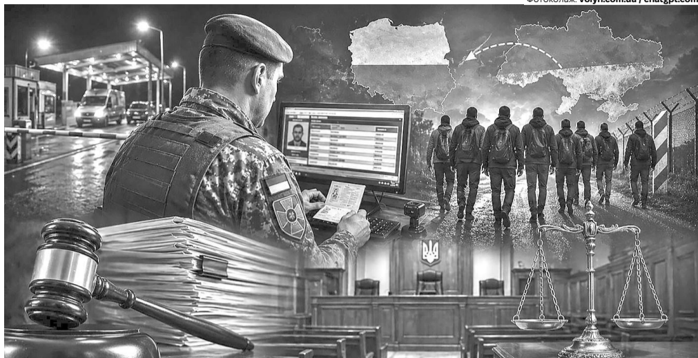
Черговий «страж» дозволяв перетин кордону тим, кому це було заборонено.

визнала прикордонника винним за ч. 2 ст. 332 (незаконне переправлення осіб через державний кордон) та ч. 3 ст. 419 (порушення правил несення прикордонної служби) КК України й призначила два роки позбавлення волі. Водночас замінила це покарання на два роки іспитового терміну. Вирок ще можна оскаржити в апеляційному суді.