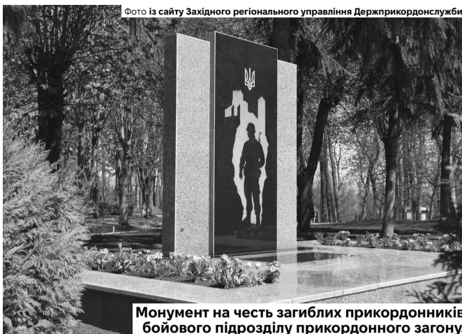
Монумент на честь загиблих прикордонників бойового підрозділу прикордонного загону.

Після пам'ятних заходів учасники перейшли до відзначення військовослужбовців, котрі нині продовжують мужньо боронити державний кордон. Началь-