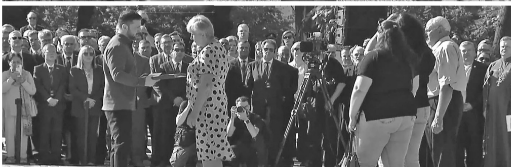
Василь Саливончик залишив побратимам шанс на життя, а рідним і всій Україні – приклад мужності, перед яким схилив голову і президент країни, коли вручав мамі «Зірку Героя».

ки зробили ДНК-експертизу, щоб підтвердити батьківство дитини від цивільної дружини, й онук отримав передбачену грошову виплату від держави.