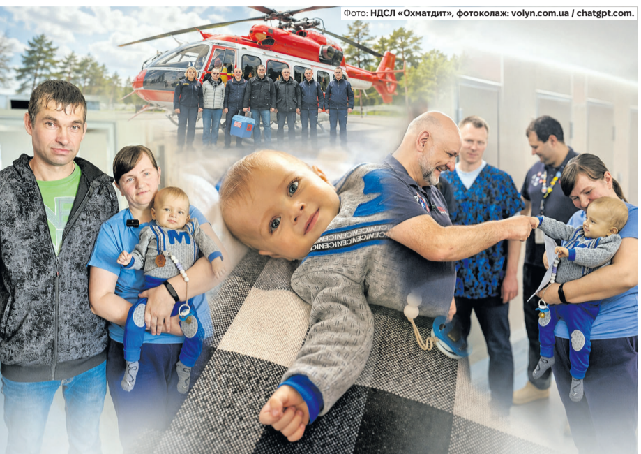
Коли рахунок ішов на години, у небо підняли гвинтокрил: так для 8-місячного волинянина почалася дорога до нового життя.

Ніхто з родичів як донор не підходив, тому надія залишалась тільки на неродинного донора.