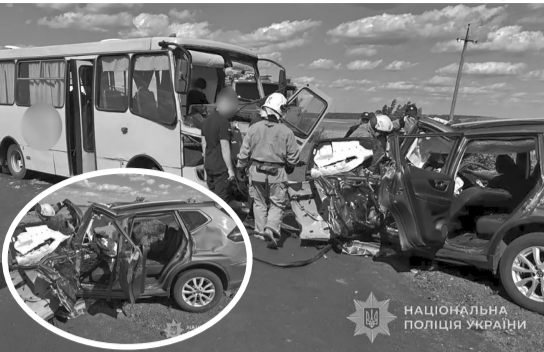
Рятувальники витягають постраждалих у жахливій ДТП.