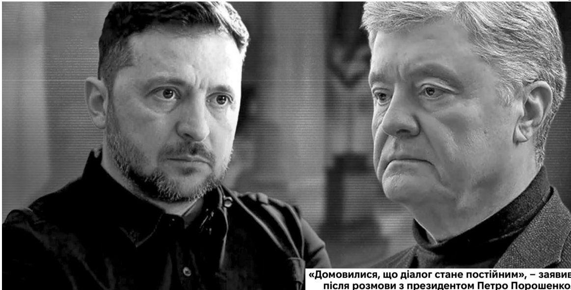
«Домовилися, що діалог стане постійним», – заявив після розмови з президентом Петро Порошенко.