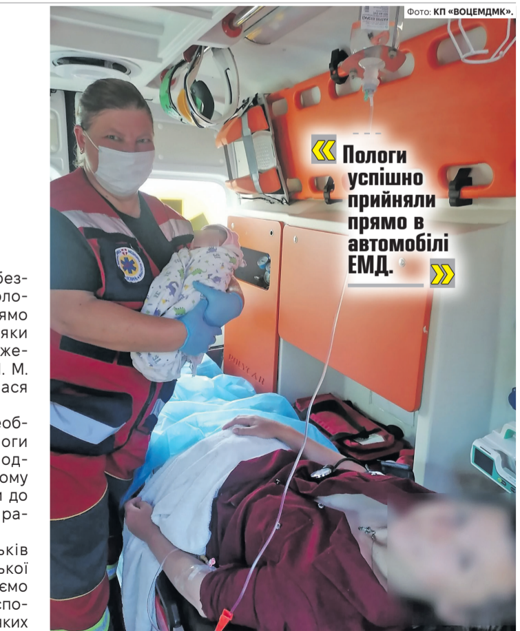
Сонечко, нехай твоє дитинство буде мирним!

Медики оперативно прибули за адресою, проте маля так поспішало на світ, що ви-