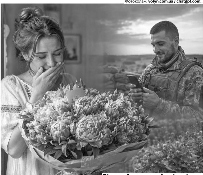
Він прийшов до неї... півоніями.

Вона жартувала, що скоро всі продавчині квітів у місті знатимуть його в обличчя. – Нехай знають, – відпові-