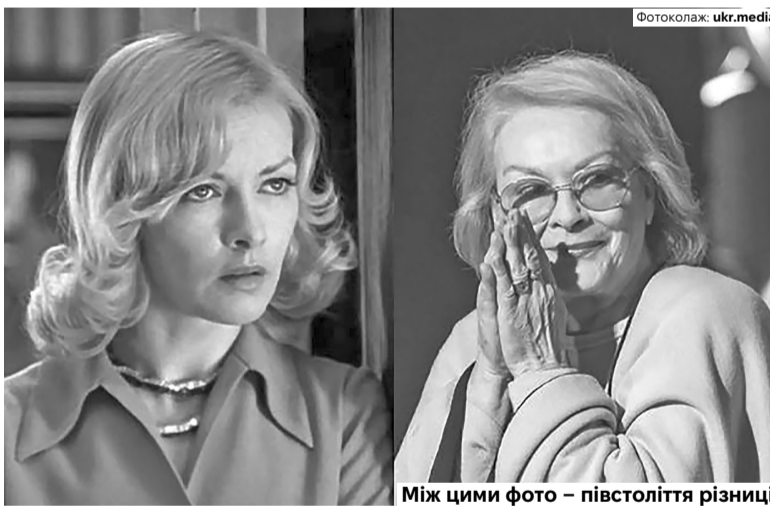
85-річна польська акторка, найбільш відома завдяки фільму «Іронія долі, або 3 легкого парю!» (1975), зізналася, що має серйозні проблеми зі здоров'ям