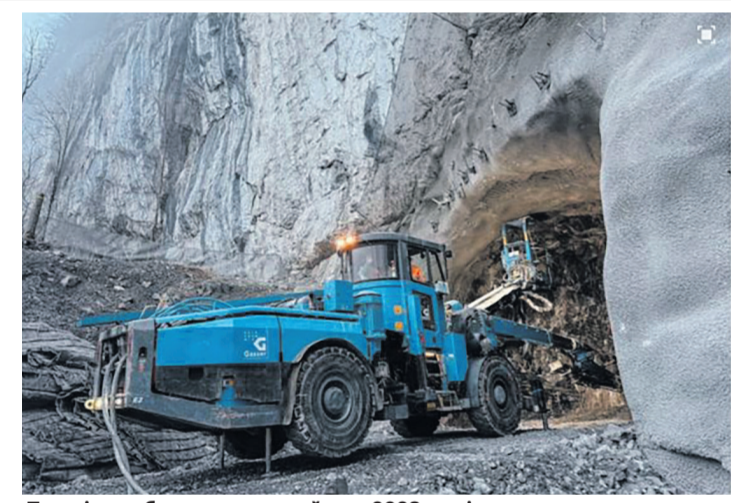
Перші скарби сховище прийме в 2028 році.

локація з фільмів про Джеймса Бонда. «Тут буде розташований контрольний-пропускний пункт. Тут оглядатимуть вантажівки та автомобілі, які наші клієнти використовують для доставки