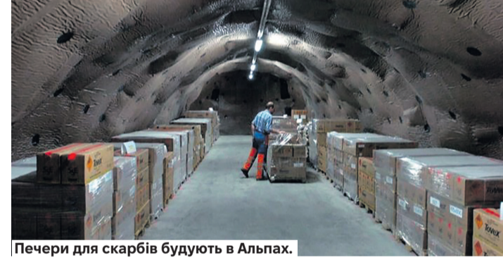
Печери для скарбів будують в Альпах.