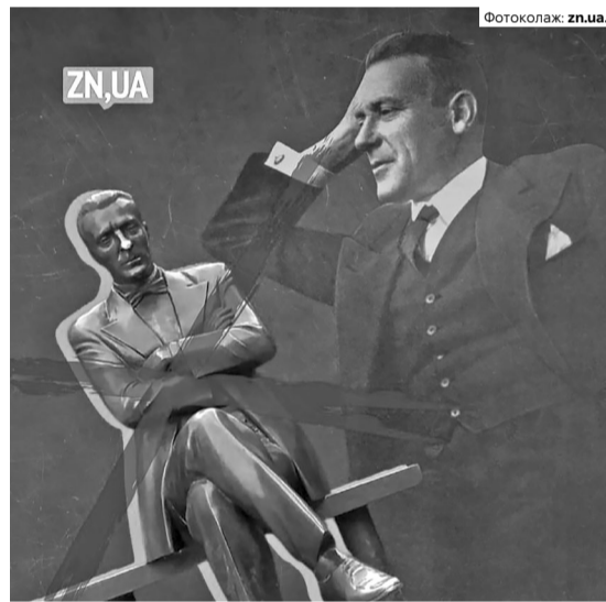
На столичному Подолі більше нема прихильника «руського міра» Михайла Булгакова (1891–1940).

Чи будуть в Україні, яка відіб'ється (від російської навали. – Ред.), читати Булгакова чи Ахматову? З роками будуть – але в українському перекладі і з усвідомленням контексту. Але пам'ятників діячам ро-