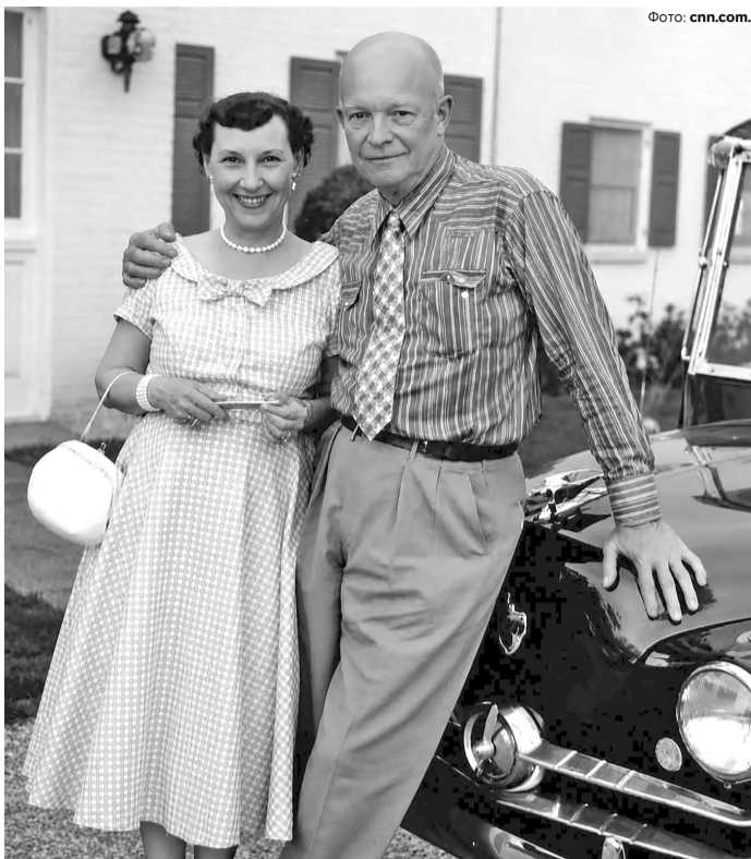
Через 37 років після їхнього скромного весілля у 1953-му Дуайт Ейзенхауер став президентом США. А Меймі – першою леді.

Це був не коштовний подарунок. Але в ньому було головне – серйозність наміру.