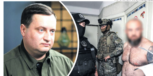
Андрій Юсов став «ціллю» у новому вбивстві, яке організували російські спецслужби.