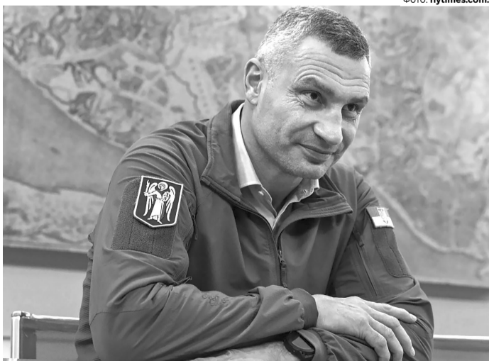
«За роботою родини немає, друзів немає, часу немає, життя немає», – чесно зізнався міський голова Києва 54-річний Віталій Кличко.

«А воно того варте було – йти в політику, щоб усе це втра-