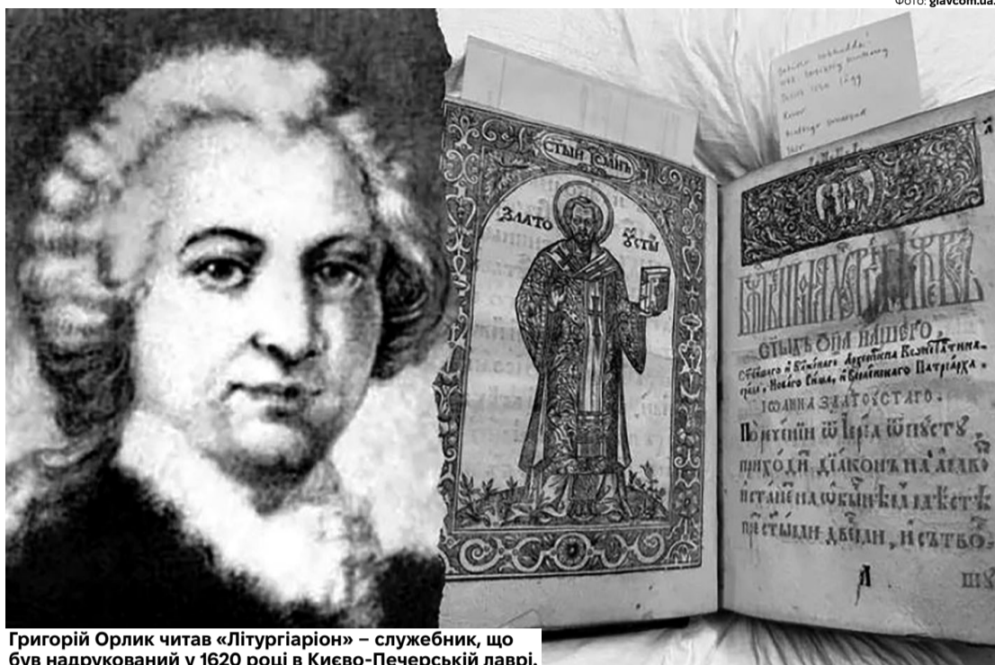
Григорій Орлик читав «Літургіаріон» – службник, що був надрукований у 1620 році в Києво-Печерській лаврі.

Григорій Орлик (1702–1759) був сином гетьмана Пилипа Орлика (1672–1742), військовим діячем та майстром таємної дипломатії при дворі французького короля Людовіка XV