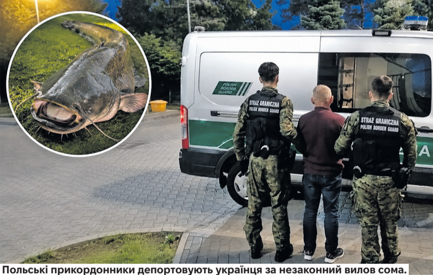
Польські прикордонники депортували українця за незаконний вилов сома.