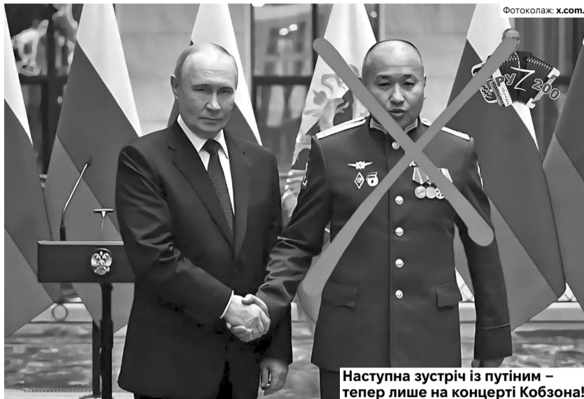
Наступна зустріч із путіним – тепер лише на концерті Кобзона!

Наран Очір-Горяєв народився в місті Лагань у Калмикії. До повномасштабного вторгнення служив у російській поліції, мав відрядження до Чечні та Дагестану –