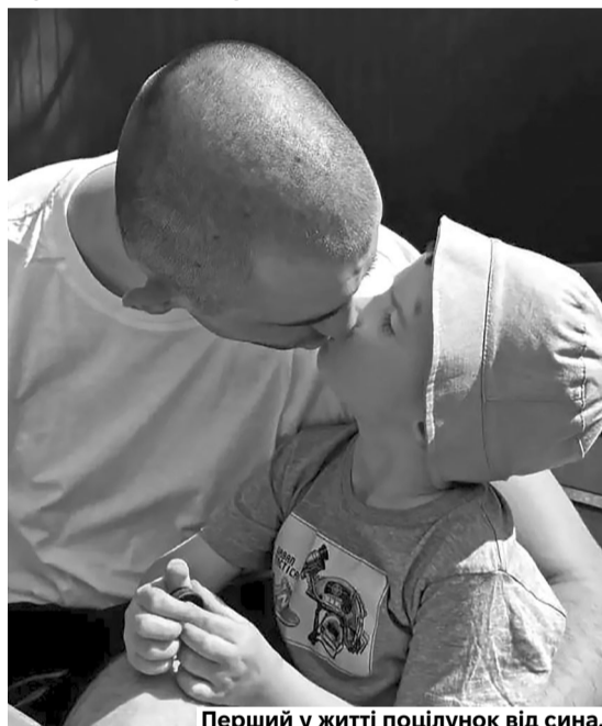
Перший у житті поцілунок від сина.

Родина написала йому відповідь і вислала фото малюка, сподіваючись, що лист дійде.