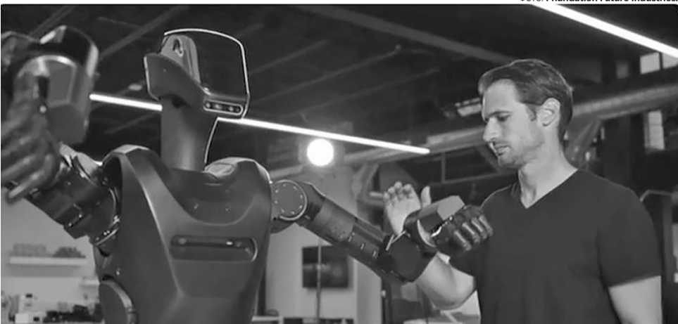
Робот-гуманоїд Phantom MK-1 – це перший у світі людиноподібний робот, розроблений американським стартапом Foundation спеціально для бойових та екстремальних умов.