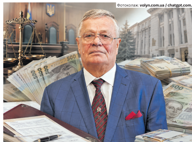
Поки більшість українських пенсіонерів рахують копійки, Василь Німченко судиться за збільшення своєї і так космічної пенсії.

Народний депутат восьмого скликання Василь Німченко, який також є суддею Конституційного суду України у відставці, отримує найбільшу пенсію серед парламентарів