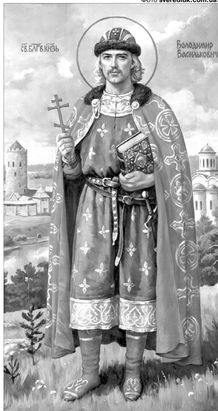
Таким побачив благовірного правителя сучасний художник Артур Орльонов.

ня дороге, і пояси золоті отця свого, і срібні, і своє, що після отця свого придбав був... І блюда великі срібні, і кубки золоті та срібні сам він перед своїми очима побив і перелив у гривні;