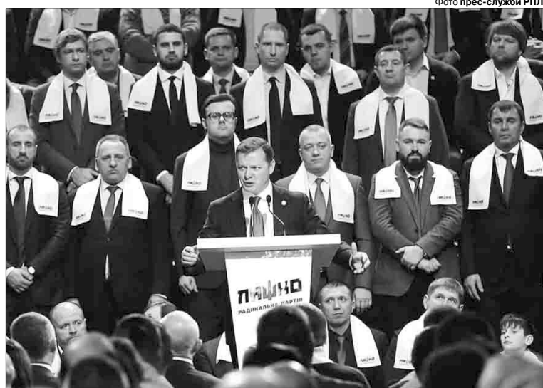
Лідер РПЛ порадив колегам по парламенту скласти звіт перед людьми, а вже потім іти на вибори.

двократного збільшення мінімальної зарплати — а це додаткові гроші для 4 млн наших співвітчизників. І перерахунок пенсій для 5,5 млн осіб, адже Пенсійний фонд отримав додатково 40 млрд гривень.