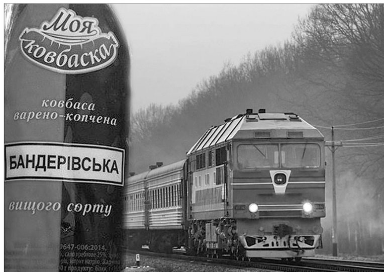
Ось такий ексклюзив був серед подарунків, які везла до Білокам'яної.