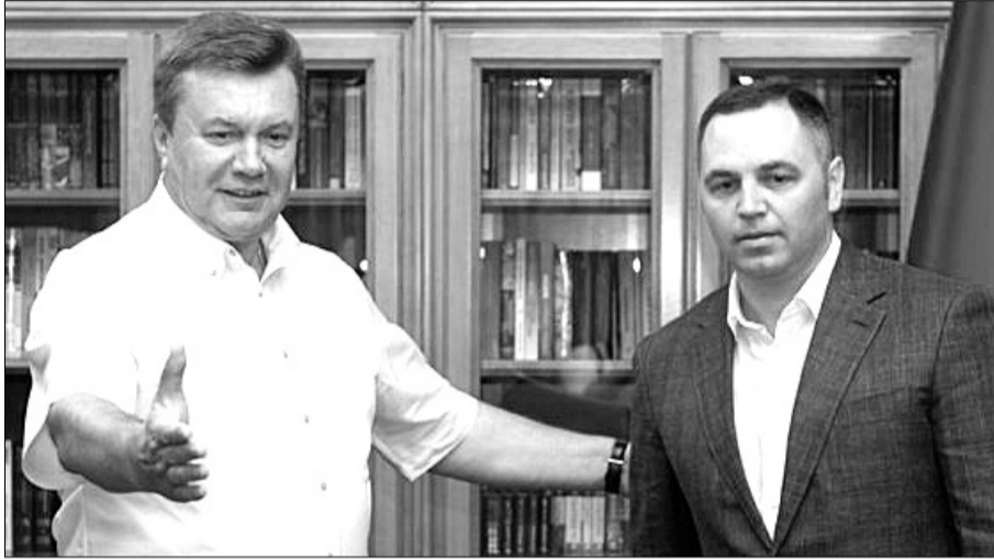
Після повернення з вигнання соратник президента-втікача Андрій Портнов почав нацьковувати на Петра Порошенка правоохоронні органи, використовуючи брудну технологію юридичного спау.

Поспіх ДБР можна пояснити нещодавнім голосуванням парламенту про перезапуск бюро, згідно з яким Роман Труба втратить свої повноваження. Фактично це останній шанс Труби і його куратора