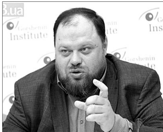
«Тещо, дай на машину — дам тобі за квартиру!»

«Після того, як Руслана Стефанчука обрали народним депутатом, він вирішив платити мамі-тещі за оренду помешкання — 20 тисяч гривень щомісяця!»