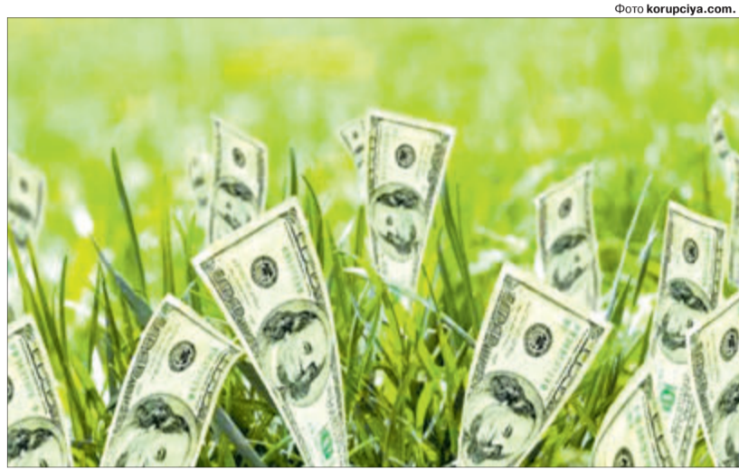
Як гадаєте: кому дістануться долари з української землі?

Я розумію, що продавати землю можуть ті, хто не має змоги її обробляти, люди старшого віку без нащадків. Вони можуть торгувати землею. Але все це повинно бути під контролем держави та місцевих територіальних громад, щоб не порушувати екологію та не руйнувати природу. Я розділяю думку, що людина, яка не може користуватись землею, має право продати її, — але в державний земельний банк, а він вже продасть її тому, хто купить