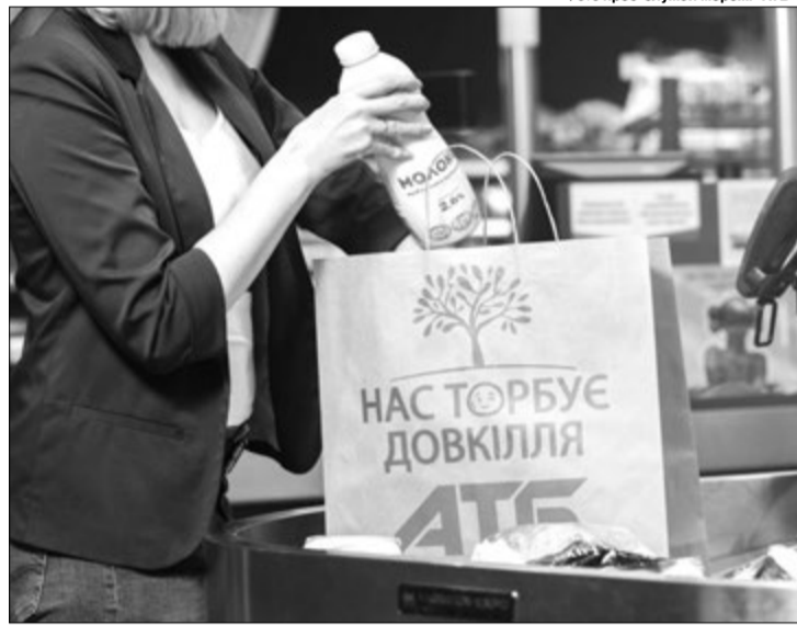
Щомісяця десятки сімей загиблих захисників отримують від «АТБ» продуктові набори.

Щомісяця десятки сімей загиблих захисників отримують від «АТБ» продуктові набори, до яких входять основні