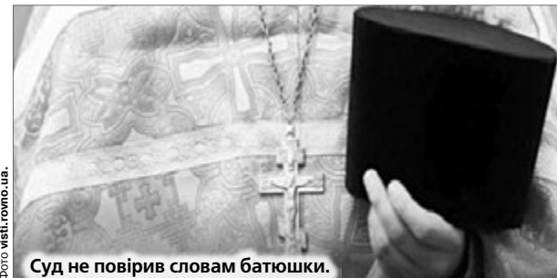
Суд не повірив словам батюшки.

Але! Сам Тищенко заявив, що насправді розмова була не жорсткою, а «професійною», і взагалі — стосувалась... зовсім іншого. Отакої. Здається, тут ситуація така: брехун на брехунові іде і брехуном поганяє.