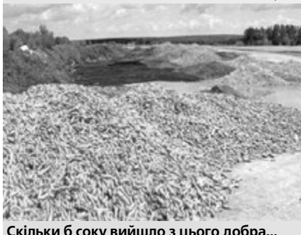
Скільки б соку вийшло з цього добра...