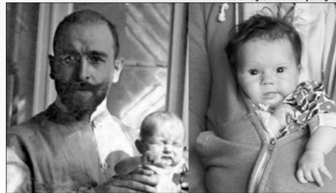
Перш ніж бігти до аптеки по антибіотики, скористайтеся порадами відомого педіатра.