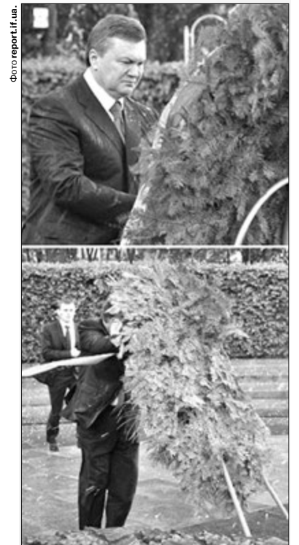
Правильний вінок: і Янукович по головешці дав, і для політичних в'язнів трохи грошей «заробив».

17 травня 2010 року під час вшанування пам'яті невідомого солдата в Києві із колишнім президентом України Віктором Януковичем стався курйозний інцидент. На очах журналістів та тодішнього очільника Росії Дмитра Медведєва українського