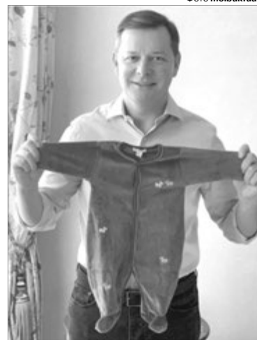
У Верховну Раду не потрапив – є час на повзунки.

Народжувала Росіта у Києві. Хлопчика, за повідомленнями деяких ЗМІ, назвуть Олександром.