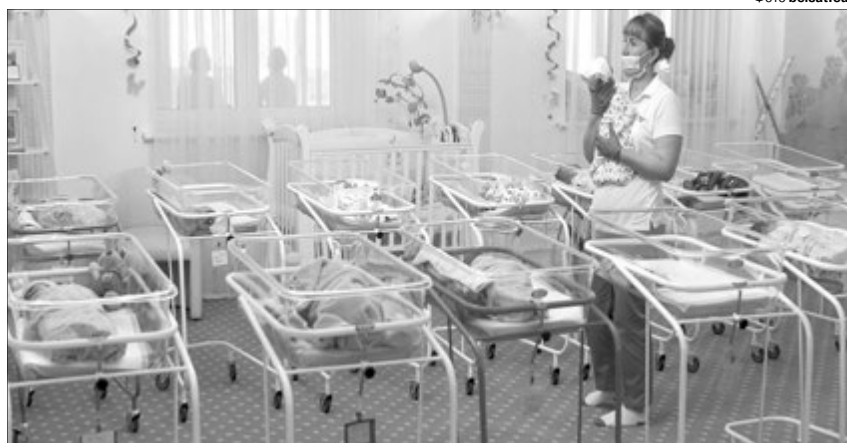
Ці діти роз'їдуться по всьому світу, і більшість із них навряд чи коли-небудь дізнається про маму з України, яка їх виносила.

Сурогатне материнство — коли жінка погоджується завагітніти та народити біологічно чужу їй дитину, яка буде потім віддана на виховання генетичним