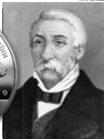
У 2015 році до 240-ліття від дня народження бджоляра Національний банк України випустив ювілейну монету номіналом дві гривні.

тини землі і взяв у борг трохи грошей, щоб влаштувати своє господарство та його головний осередок — пасіку. Сам виготовляв вулики і випробовував їх, уважно спостерігав за поведінкою бджіл, вів щоденник, займався лікуванням комах. Петро Прокопович був відданий своїй справі, як ніхто інший. За лічені роки став знаменитим бджолярем, створив найбільшу не тільки в Україні, а й у світі пасіку — більше 10 тисяч бджолиних сімей!