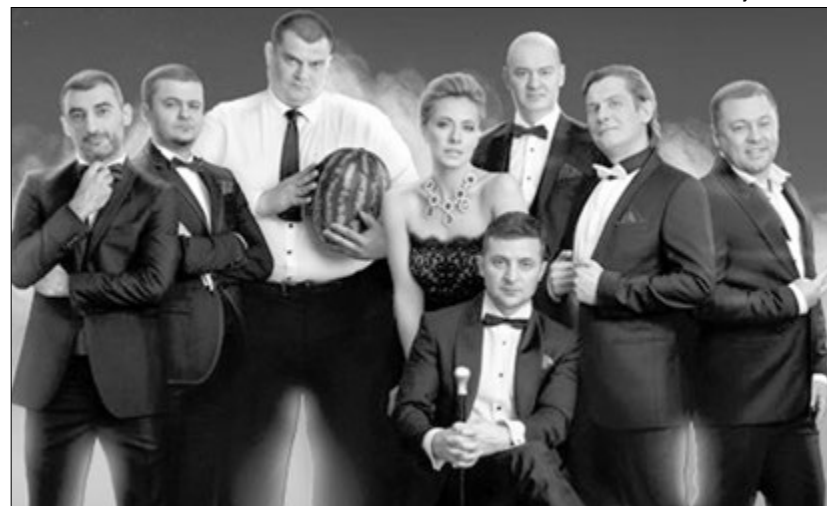
«Квартал 95» переїхав на Печерські пагорби.

Сергій Шефір (сценарист, продюсер, директор «Студії «Квартал 95») — перший помічник Президента.