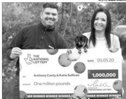
Переможець упевнений, що Небо віддячило йому за добрий вчинок мільйоном фунтів.

Обоє чоловіків досі не втрачають зв'язок, зідзвонюються: один розповідає, як іде на поправку, а інший – на що збирається витратити свій мільйон.