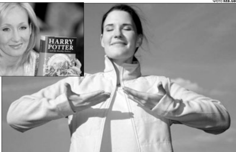
Дихальна гімнастика має стати «прологом» традиційної ранкової зарядки.