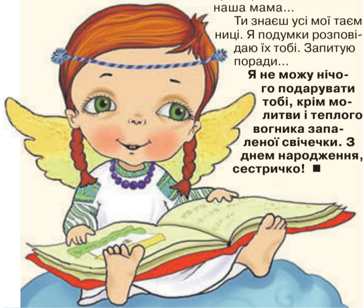
Малюнок Мар'яни ФЛЯК.

Я не можу нічого подарувати тобі, крім молитви і теплого вогника запаленої свічки. З днем народження, сестричко! ■