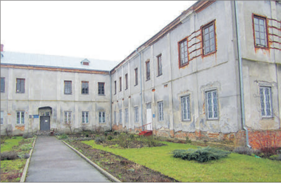
У цьому будинку монахині живуть вже 15 років.