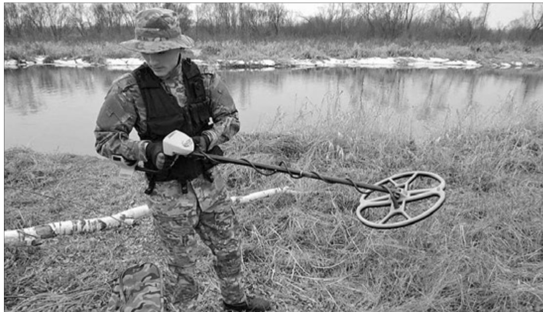
Їхня зброя — сучасні металодетектори.

За незаконне проведення археологічних розвідок, розкопок, інших земляних чи підводних робіт на об'єкті археологічної спадщини пропонується збільшити штраф до 300 неоподатковуваних мінімумів доходів громадян