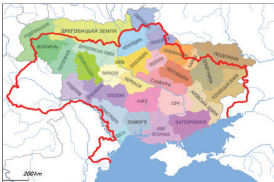
Кордони УНР не співпадають із межами сучасної держави.

Того дня Центральна Рада прийняла Закон «Про адміністративно-територіальний поділ України». Цим документом відмінили губернії та повіти,