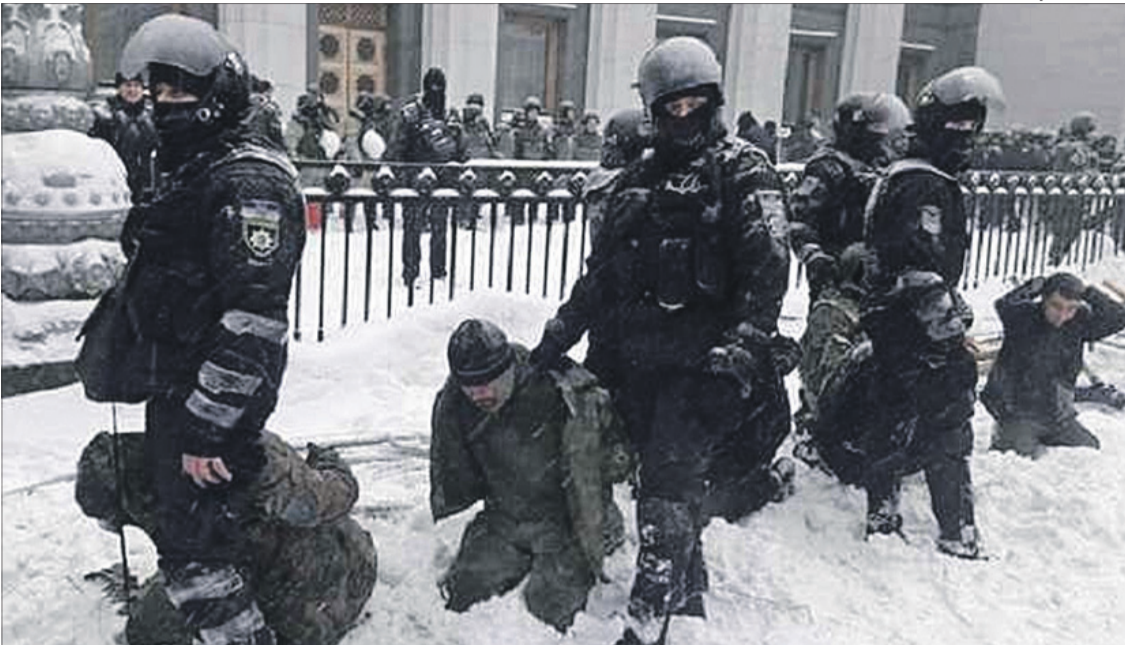
Чи не навіює ця фотографія спогади про звірства чотирирічної давнини?