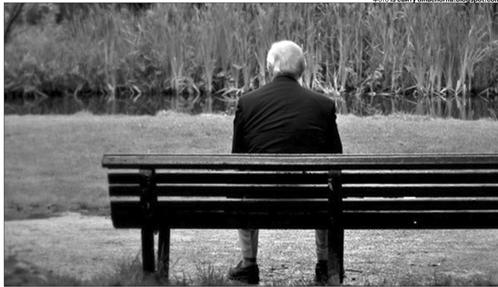
«З тієї лавки, яку облюбував Ростик, добре видно лікарняні двері».

...Віта ходила з гуртожитку до училища вулицею, на якій Ростик жив із новою дружиною. Але тоді вона не знала, що він мешкає тут.