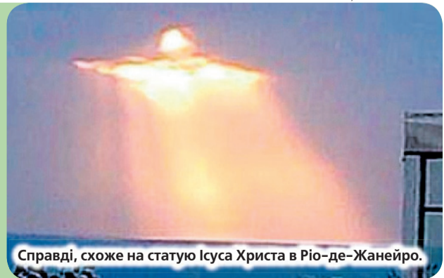
Справді, схоже на статую Ісуса Христа в Ріо-де-Жанейро.

Знімок зробив Ло Брутто знаменитим, про його фотографію розповіли багато видань, адже сталося це ще в березні 2019 року.