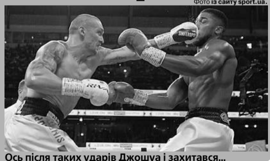
Ось після таких ударів Джошуа і захитався...

Українець був досить близько до дострокової перемоги. Потрібно поставити його в один ряд з боксерами рівня Евандера Холіфілда, адже він зробив свою роботу в бою з Джошуа. З огляду на сказане, я дуже розчарувався в Ентоні», — наголосив Воррен.