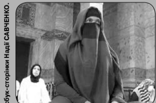
Цікаво, думає таким чином привернути увагу чи врешті мріє вийти заміж?

За словами Надії Савченко, саме країни, де більшість громадян сповідують одну релігію, найміцніші.