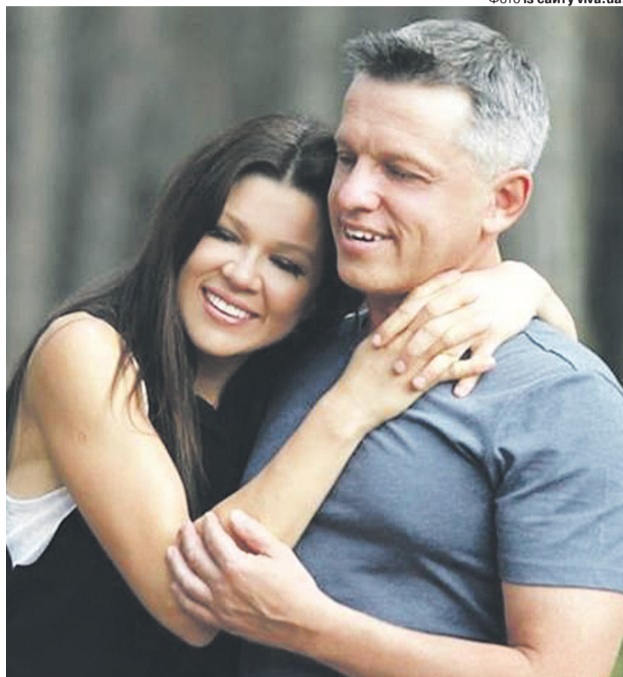
«Найзаповітніша мрія Мавки — мати дитину від Лукаша».