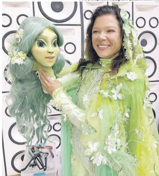
Невже під завітчанним костюмом Мавки Руслана ховала животик?