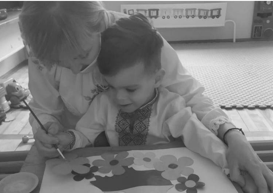
Данилко – один із тих, кому педагоги «Проліска» показали, що життя не обмежується чотирма стінами.