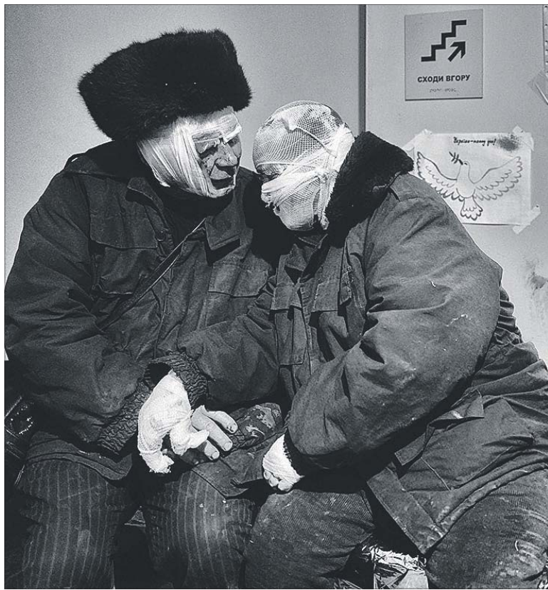
«У радості й горі, у багатстві й бідності, у хворобі й здоров'ї... навіть пекло війни не розлучить нас», — підписала цей знімок пресслужба Міноборони.

Воєнний фотограф з Голландії Едді Ван Вессел (Eddy van Wessel) поділився світлиною пари стареньких із Бахмута. Він написав, що сфотографував їх у лікарні 17 листопада після того, як у їхній дім влучила російська ракета. В обох героїв фото забинтовано голови, а в жінки ще й руки, їхній одяг пошарпаний. На стіні за спиною поранених стареньких — малюнок із голубом миру й написом «Україна понад усе».