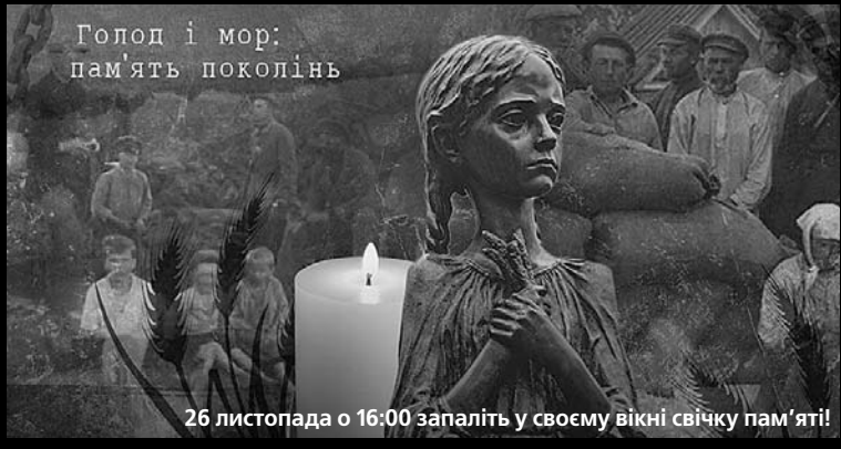
26 листопада о 16:00 запаліть у своєму вікні свічку пам'яті!