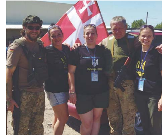
Вони відстоюють Україну, як можуть: роблять тушкованки й буржуйки, купують речі й ліки, автівки й генератори для своєї армії.

Ми вже маємо 68 поїздок на передок: Харківська, Донецька, Миколаївська і Херсонська області, була й Одеська. Знайомі не вірили, що доїду туди, але знайшла такого водія, що хай бажкає над головою, а він робить свою справу. Я купувала паперові карти й прокладала по них маршрути. Одного разу опинилася за 500 метрів від окупантів. З тих пір дуже обережна. У «Сигналі» питаю в хлопців з передової, куди і як зможу доїхати. Повірте, місяцеві не скажуть, яка дорога правильна... Спочатку нас не пускали на блокпостах наші: казали «баби-дури» й «рівняння на красу». Але ми їхали й верталися. Знаємо, які фото можна виставити в соцмережу, а які ні. Я розумію, якщо не дай Бог якась ДРГ, то мій телефон має згоріти, бо там багато інформації. Після перших поїздок на передову я верталася й просто захворювала: тут люди ходять у кафе, а там діти не мають що їсти. Зараз уже легше ставлюся.