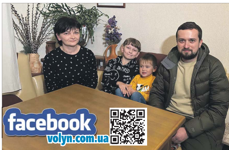
Тепер сфоткатися із Назарчиком Будком хочуть і перші люди держави.

«Нічо! Помиєм! Не плач, успокойся, не психуй!» — десь