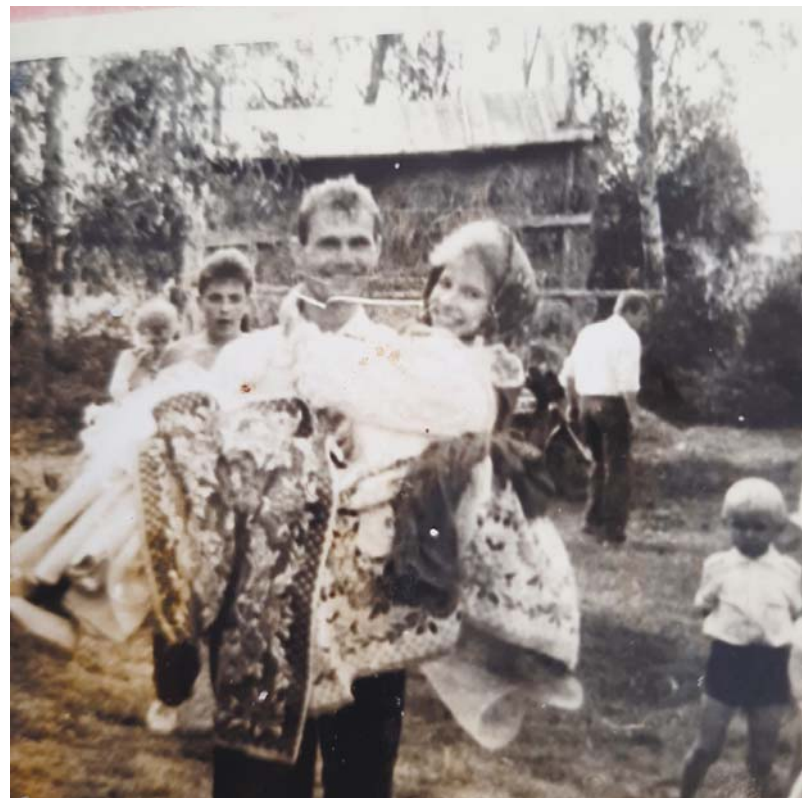
Тепер їхнє щастя залишиться лише на фотографіях, які зберегли миті з незабутнього весільного дня, з молодих літ, коли росли дітях, дім свій будували...