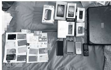
Результати обшуків виявилися щедрими.

регіонів України. Сума матеріальних збитків становить понад 135 тисяч гривень.