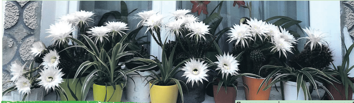
Просто подивіться ще раз на цю красу!