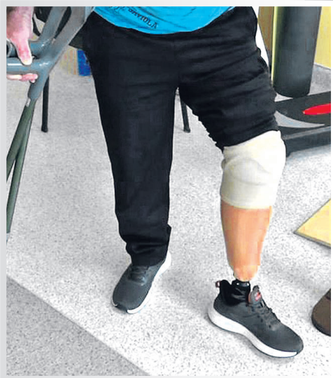
За підтримки найрідніших він знову повертався до життя.