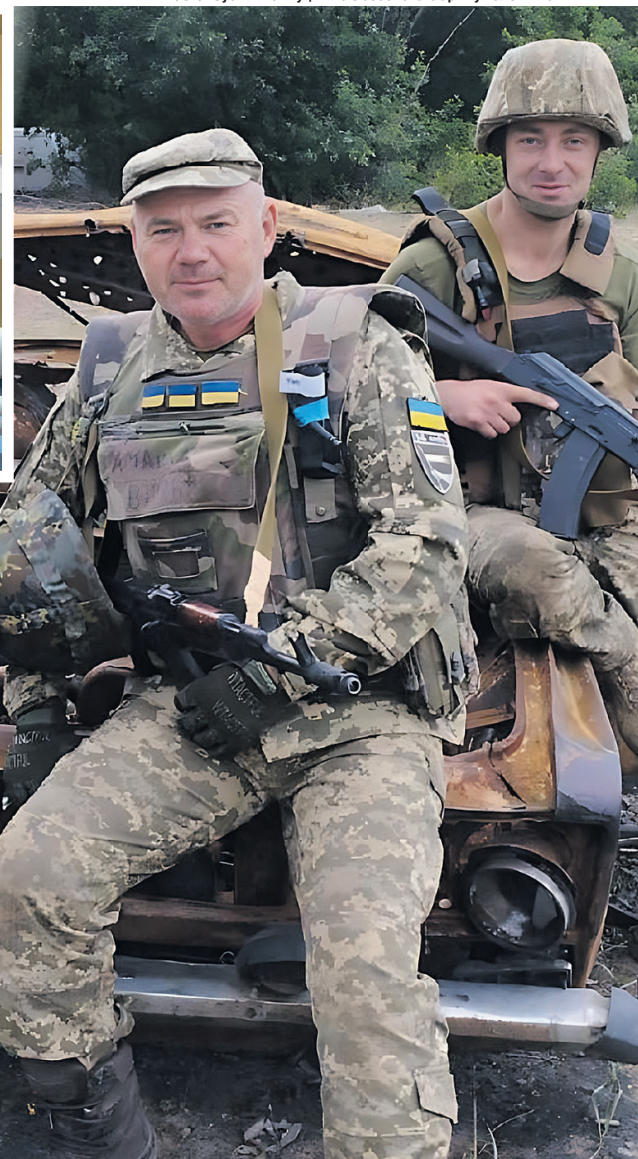
«Спочатку був на Донеччині. Потім перекинули на Харківщину, ближче до російського кордону. Після цього воював на Луганщині».