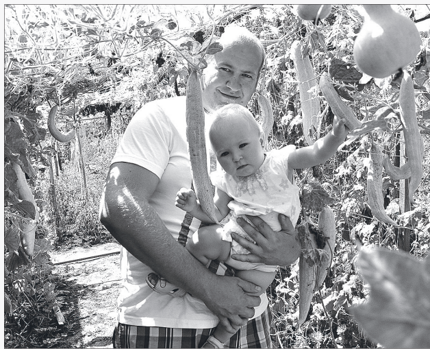
Поряд з нами є рослини, котрі обов'язково допоможуть.