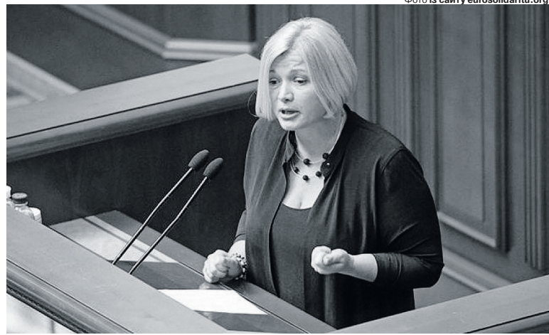
«Владою запущена ефективна технологія дискредитації і знецінення «Європейської Солідарності».

Ми відповідали за свободу слова. Тому радянське УТ стало «Суспільним», і там йшли розслідування Бігуса і Ткача. Сьогодні там «марафон» і немає опозиції, але багато позаштатних радників і радниць Офісу