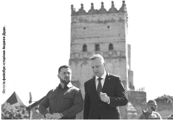
«Свідчення дружби в умовах складної історії».

митрополит Луцький і Волинський Михаїл, глава Української греко-католицької церкви Блаженніший Святослав.