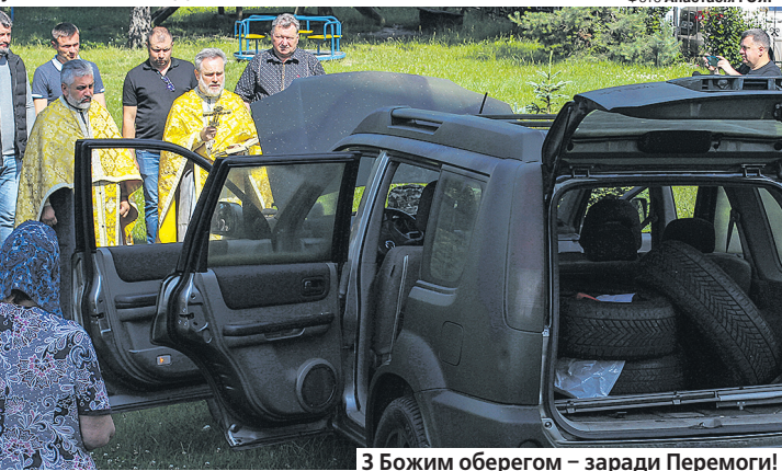
З Божим оберегом – заради Перемоги!