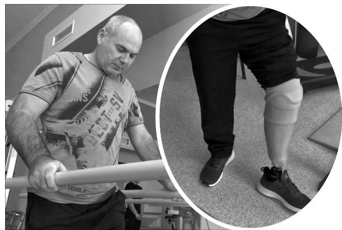
У Луцьку захиснику встановили протез.

небезпека від підступного ворога підстерігала на кожному кроці. Ось такий один крок і став вирішальним у його житті.