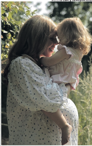
Діти – найбільше щастя батьків. До речі, різниця у віці між татом і мамою – 23 роки!