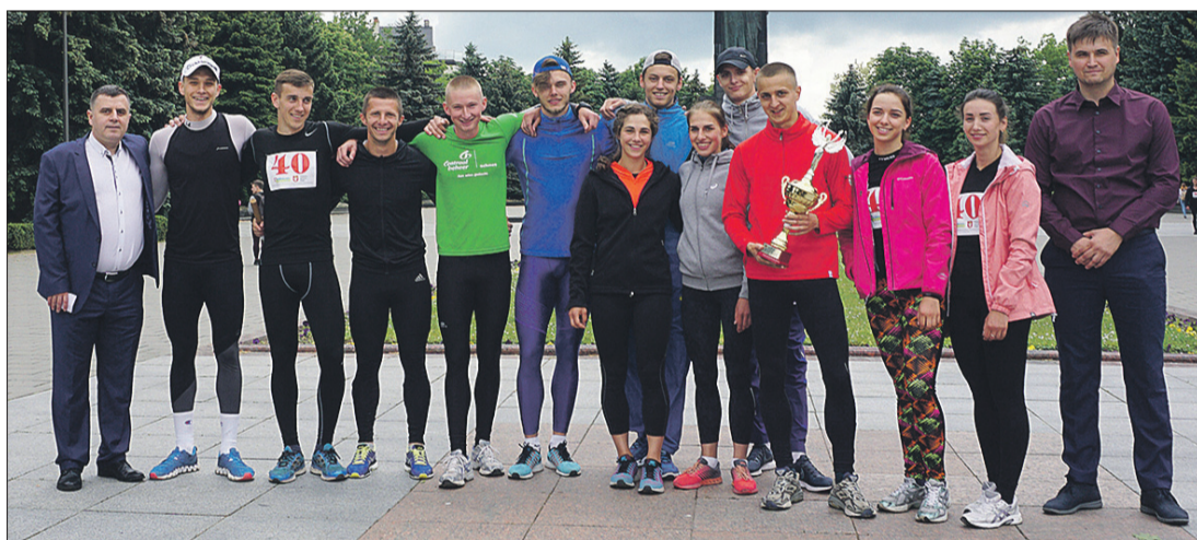
Команда СХУ імені Лесі Українки разом із організаторами акції.

Уже на перших метрах дистанції виникає вкрай непередбачувана ситуація. Фотокоордінатор одного з місцевих інтернет-видань «ловить гаву» і не встигає вчасно відскочити з проїжджої частини проспекту Василя Мойсея, де й стартує забіг. Через нього перечіплюється один із легкоатлетів. Спортсмен драматично робить зо три переверти асфальтом, проте миттєво спинається на ноги й, навіть не озирнувшись на призвідника «аварії», мчить наздоганяти суперників! (Хоча, якщо серйозно, тому «журналюзі» за таке й «червону картку» виписати мало було б!)