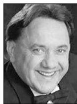
Богдан БЕНЮК, народний артист України (м. Київ):

Чи скористалися ви «безвізом», який уже рік діє в Україні?