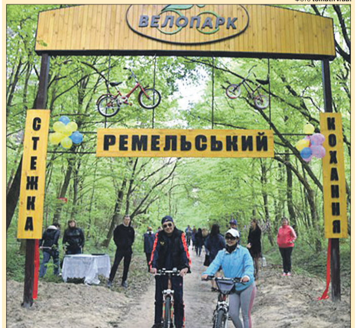
Сюди приходять і приїжджають по здоров'я та добрий настрій.