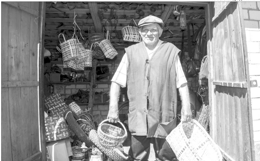
Такі вироби згодяться на обійсті кожного сільського господаря.