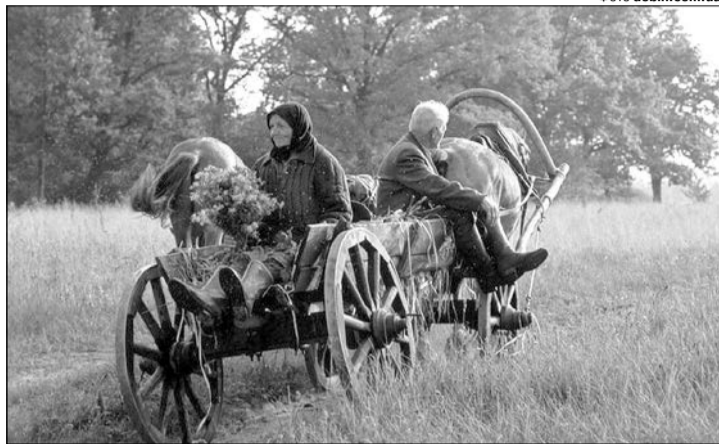
І в XXI столітті — це найкращий транспорт?

Якось світло в кінці тунелю з'явилося у вигляді більш-менш регулярного рейсу, який заходив у сусіднє село Ключьк. Раділи тагачинці й цьому. Велосипедами-мопедами-підводами добиралися хоча б до такої напівдороги і далі могли їхати як цивілізовані пасажирки. Кінець і цього блага настав уже більше місяця тому із не зовсім логічної з «дорожньої» точки зору причини. Щобенем вирівняли відрізок шосе, і камінці стали, за словами водія автобуса, колоти шини. Все