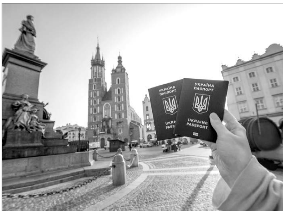
Європа відкрита. Та не для наших гаманців...

— Особисто я не скористався, бо маю паспорт старого зразка з відкритою візою до травня 2019-го. Торік лише раз побував за кордоном, у Польщі, у службових справах. Нинішнього року, кілька днів тому, знову відвідав містечка Грубешів та Замость для налагодження подальшої співпраці з нашими партнерами. Біометричний паспорт, очевидно, треба виготовляти. Але за цю справу візьмусь тоді, коли вже не буде черг — хай громадяни, які мають якісь конкретні плани, поки що це роблять. Оцінюючи рік дії безвізового режиму, скажу про його два суттєві моменти. Плюс у тому, що нині українці мають можливість поїздити світом, побачити, порівняти. А мінус — за цей час багато чудових фахівців — програмістів, медиків, учителів — знайшли роботу в інших країнах. Тому наше завдання — зробити так, аби молодь залишилася в Україні, розбудувала її, робила справжньою європейською державою. Щоб за кордон їздили лише на екскурсію.