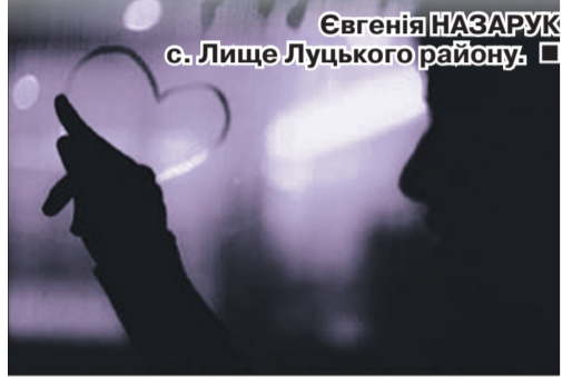
Свєнтія НАЗАРУК с. Лище Луцького району.

Я втомилась... І уже не знаю — Чи супроти світу йти, а чи... І тому молю тебе, болашо: — Не мовчи!.. Ти чуси, не мовчи!!!