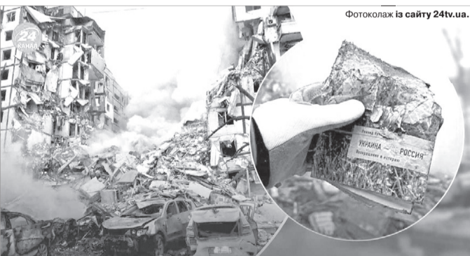
«Сьогодні ж я відчуваю безмежну гордість за Україну і безмежний гнів до росії», – написав Кучма в післямові до книги.

звичайному панельному будинку в Дніпрі, і на світліні з місця зруйнованого будинку він побачив пошкоджену вогнем свою книжку «Україна – не Росія».