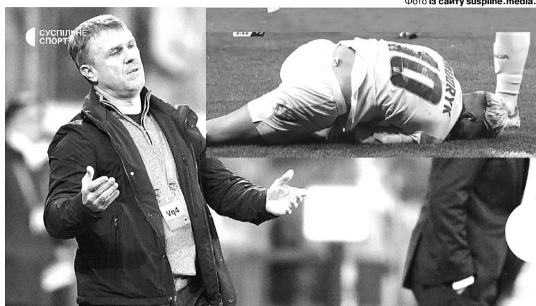
«Сьогодні була команда, яка хотіла пройти далі, тож я дивлюся з оптимізмом у майбутнє».

– Ми грали проти чинного чемпіона Європи. Дуже важко проти цієї команди постійно пресингувати. Тому в першому таймі ми більше скон-