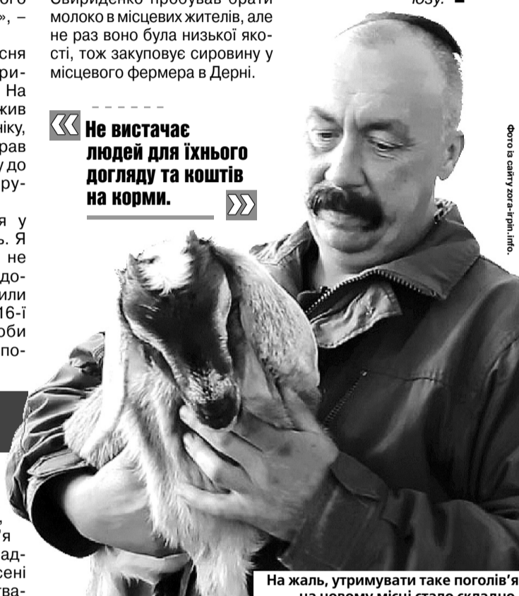
На жаль, утримувати таке поголів'я на новому місці стало складно.

«Не вистачає людей для їхнього догляду та коштів на корми.»