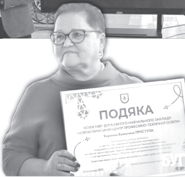
70 років – це – рубіж, який дає змогу з вдячністю проаналізувати минуле й з надією і впевненістю дивитися у майбутнє.

дів профтехосвіти Волині, влади Нововолинська, PROMIVSЬКОЇ територіальної громади, численні друзі й прихильники.