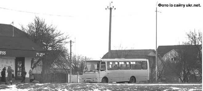
Відстань від Гути до колишнього райцентру – селища Ратного – 32 км, а до нинішнього – Ковеля – аж 85.

« Люди вже готові були перекривати дорогу, якою вивозять ліс, і «це не з метою комусь нашкодити, а для того, щоб їх почувли». До речі, в Гуті проживає 1730 осіб. »