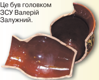
Закінчення – на с. 5

Але на Банковій більш прискіпливо поставилися до іншого рядка в дослідженні – 98% українців, тобто на 5% більше, в березні минулого року довіряли Збройним силам України. Як тоді писала «Українська правда», оточення глави держави хвилювало, через кого персоналіфікують армію. І це був не Зеленський. Це був головою ЗСУ Валерій Залужний.