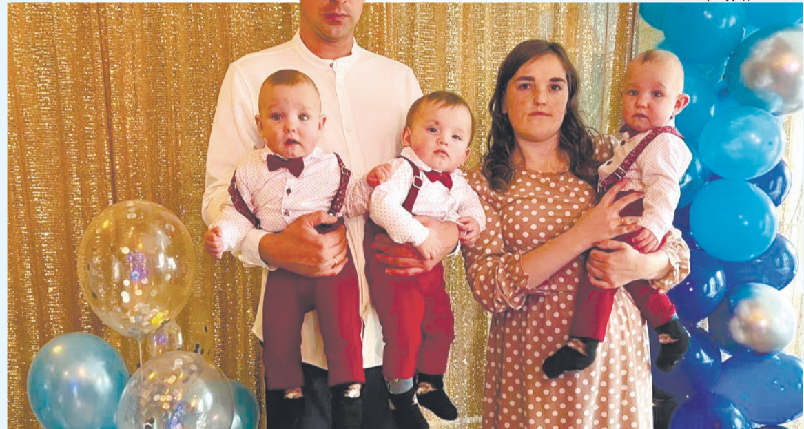
Хлоп'ята-іменинники поки що на руках у мами й тата мали вигляд справжніх джентльменів.