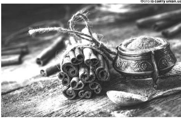
Вживання в їжу кориці здатне покращувати роботу мозку.

туди-сюди качалкою, після чого подрібніть у кавомолці або блендері. Кориця володіє знезаражувальною, антисептичною та дієтичною дією, має тонізуючий ефект. Її застосування сприятливо позначається не тільки на трав-