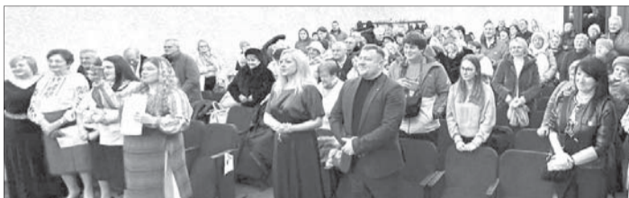
Скільки разів під час концерту звучало: «Браво, маестро!».

« За пісню «Волиняночка» («Чи є в світі де дівчина, як та Ганночка, – кароока, чорноброва волиняночка...») перевели на посаду акомпаніатора й заборонили писати. »