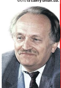
(В'ячеслав ЧОРНОВІЛ (1937 – 1999), політичний в'язень СРСР, Герой України, політик, громадський діяч, публіцист, народний депутат).

«Злодії бувають двох видів: 1. Звичайний злодій. Він краде у вас сумку, телефон, гроші... 2. Політичний злодій. Цей краде у вас майбутнє, мрії, роботу, гідну зарплату, добру освіту, ваше здоров'я... Різниця в тому, що звичайний злодій вибирає вас, а політичного вибираєте ви самі».