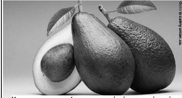
У стиглого плода м'якоть легко відділяється від шкірки.

У супермаркетах рідко вдається знайти гарний спілий плід. На жаль, не завжди можна зрозуміти, який він всередині. Зазвичай радять звертати увагу на такі нюанси