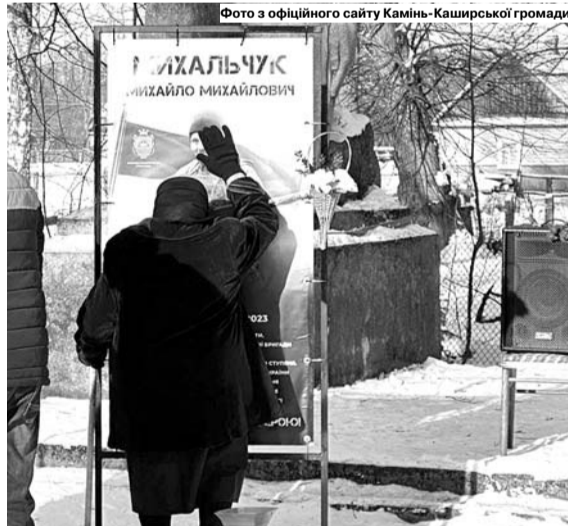
Їхня кровиночка тепер дивиться на рідних лише з фотографії...

те місце, пам'ятаймо, якого страшно ціною дається нам ця Перемога. Хочу побажати, щоб Алея не збільшувалася. Щоб ви ніколи і нікого не втрачали. Рідним і близьким від щирого серця низько вклоняюся. Нехай на нашу землю прийде мир і спокій. Слава Україні!» – сказав Віктор Іванович. ■