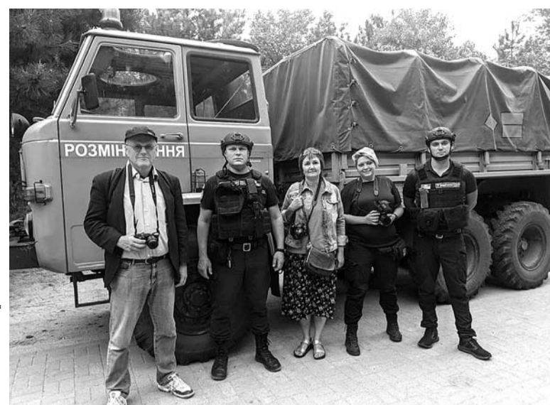
Завдяки доблесним працівникам ДСНС я мала змогу разом із німецькими та іспанськими журналістами побувати на розмінуванні.