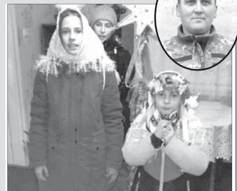
Дівчатка зуміли назбирати 1300 гривень для захисників.