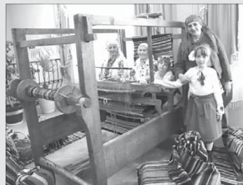
Ткацтво на Камінь-Каширщині побутує у 24 селах.