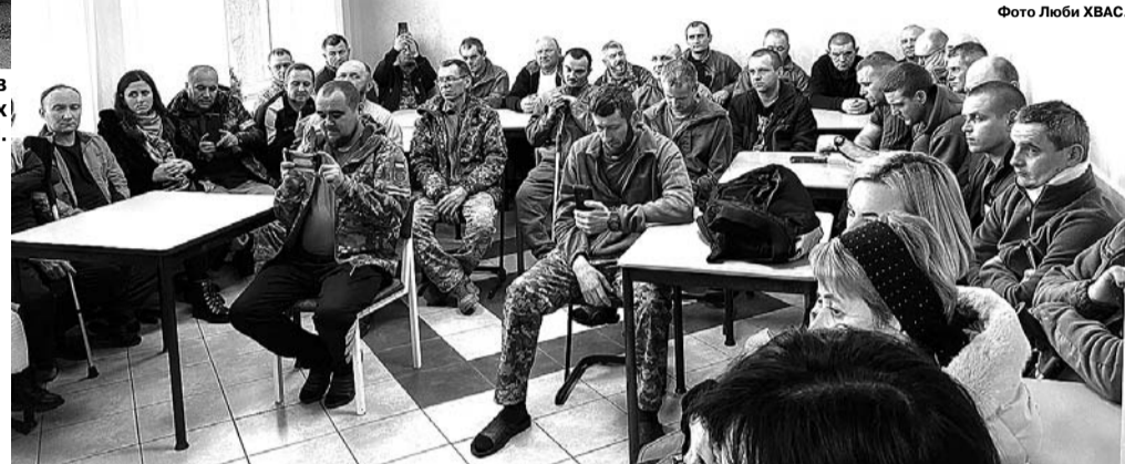
У деякого бриніли сльози – можливо, поринали у спогади свого дитинства і мирного життя.

Євгенія Іванівна розповіла, що постійно відві-