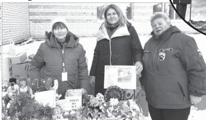
Кожна презентована річ на благодійному ярмарку – то справжній витвір мистецтва.