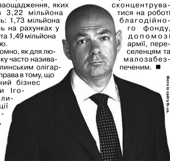
Нещодавно Ігор Палиця, який є одним із найбільших прогультників у парламенті, оголосив, що йде з публічної політики і більше не очолює створену ним партію «За майбутнє».

Він хоче сконцентруватися на роботі благодійного фонду, допомозі армії, переселенцям та малозабезпеченим. ■