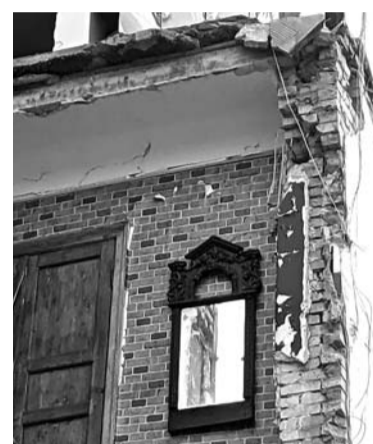
Стіни не витримали, а люстро навіть не тріснуло.