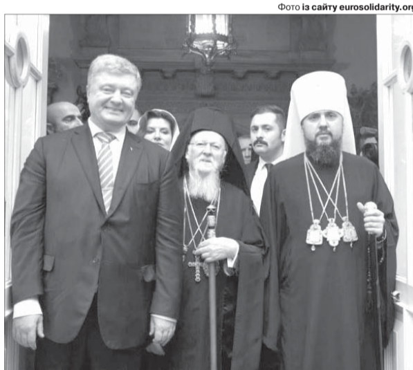
Історична мить: 6 січня 2019 року Україна отримує Томос про автокефалію Православної церкви України (ПЦУ).

«Тому я дуже добре пам'ятаю той момент. Весь день було напружене та хвилююче очікування. А потім, заставши подих, ми спостерігали, як Його Всесвятість Вселенський патріарх Варфоломій скріпив підписом історичний документ», – згадує Порошенко ту мить.