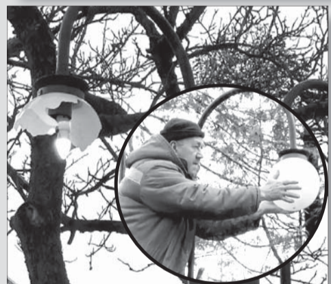
Комунальники виконали заміну шести світильників.

Обірвалося життя воїна від ворожої кулі неподалік села Завгороднє Ізюмського району, що на Харківщині, у травні 2022-го. Сім'я отримала орден «За мужність» III ступеня, яким Петра Царика нагороджено посмертно. ■