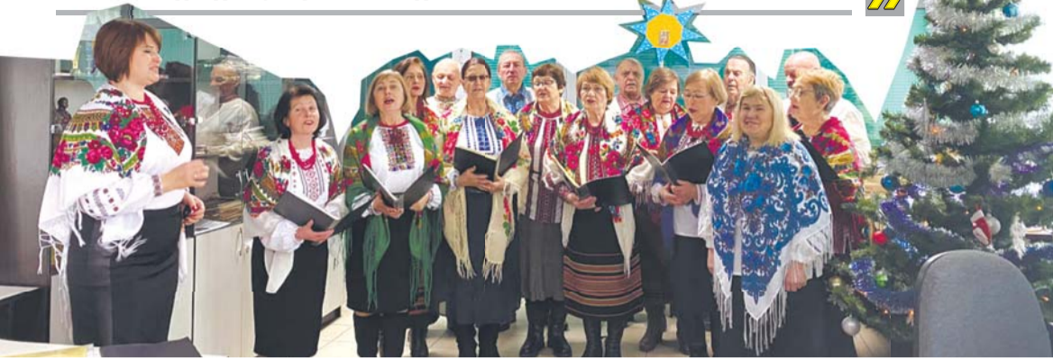
35 років тому учасників колективу «Посвіт» об'єднала любов до України та до патріотичної пісні.

«Даруючи пісні у своєму виконанні, хорова капела «Посвіт» збирає кошти на ЗСУ. Співають щонеділі у Луцьку на вул. Лесі Українки, перехожі залюбки підходять, слухають та донатять.»