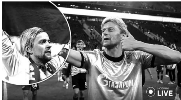
Невже тепер буде покаєння від Толика?

пресконференцію, на якій засудити війну і очистити своє ім'я. Але у підсумку він не прийав.