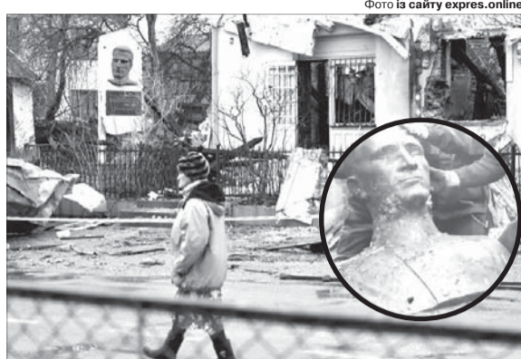
Під час розбору зруйнованої конструкції музею з-під завалів витягнули погруддя Романа Шухевича, яке збереглося, хоч і було пошкоджене. Воно і перейде в новозбудований музей.

«Переконані, що невідкладне відновлення Музею стане символом незнищенності України всупереч спробам