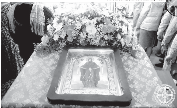
Головна ікона храму Покрови Пресвятої Богородиці у селі Залізниця.

Днями у селі Залізниця Любешівської громади Камінь-Каширського району спалахнув гучний скандал – сварилися і навіть билися прихильники упц мп та ПЦУ