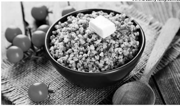
За вмістом білка ця каша – абсолютний чемпіон серед усіх круп.

Інгредієнти: 4 курячі філе, 1 скл. гречки, 2 скл. води, 500 г печериць, 1 велика цибулина, 500 мл вершків (22%), 2 ст. л. олії, 1 ст. л. вершкового масла,