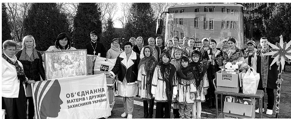
Аматорський співочий колектив «Кумоньки» віншував військових колядками.

Мужні і задумливі, різні за віком, статурою і вдачею чоловіки зібрались у ідального Волинського обласного госпітального ветеранів війни. Усі здолали своє пекло, свій шлях у боях за визволення України, у кожного – свої болючі спогади, рани на душі та тілі. Сьогодні вони проходять лікування та цінують миті спокою. Саме їм хочеться нескінченно дякувати за те, що відважно боронять на передовій рідну землю, а ми можемо тут спокійно спати