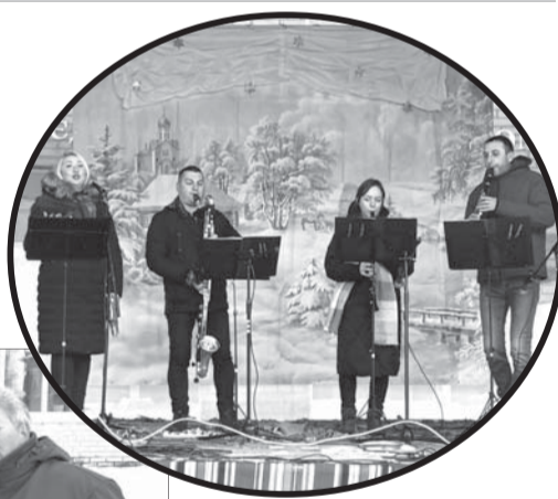
Виступ львівських артистів-віртуозів завжди сприймається з великим піднесенням.

Були цього дня й щасливчики, які виграли у лотерею фрукти, продовольчі товари, картини й багато інших потріб-