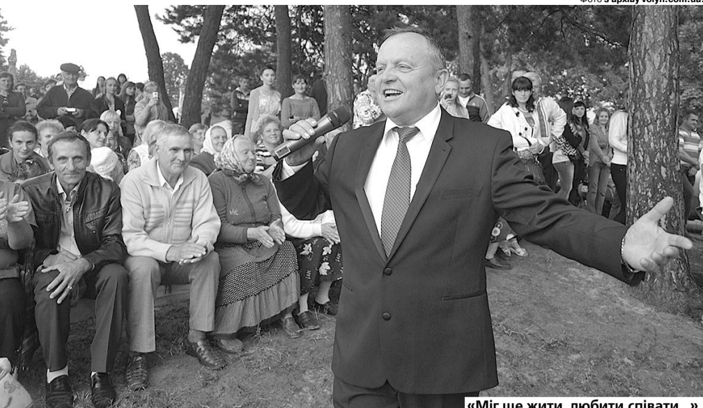
«Міг ще жити, любити, співати...».