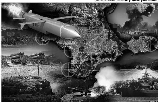
Карта військових об'єктів Криму та ракетна атака ЗСУ.

Проведено спецоперацію зі знищення логістики російських військ в окупованому півострові. Серед іншого для цього було використано модернізовані українські ракети «Нептун»