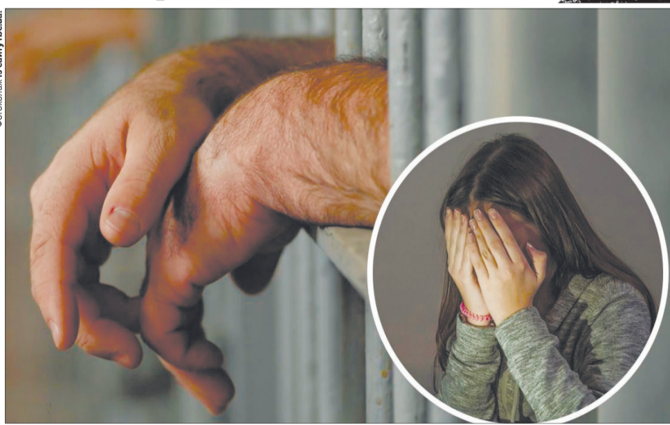
Замість трьох років умовно – педофіла засадили на стільки ж за ґрати.

потерпілу за гроші показати сідниці та груди, на що та відмовила. Зреш-