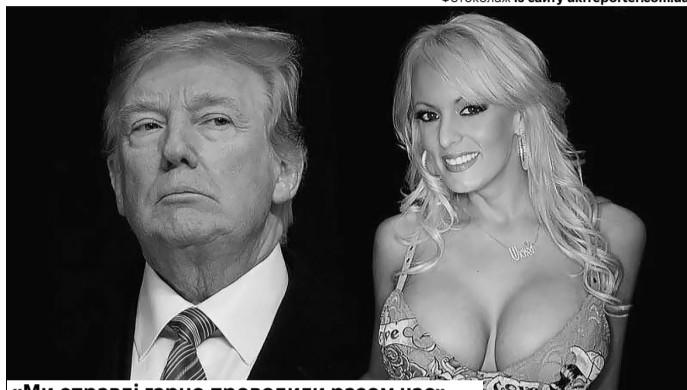
«Ми справді гарно проводили разом час», – стверджує Стормі Деніелс.

Попри кримінальні справи, Трамп бере участь у президентських виборах 2024 року. До того ж, цей провидський користується чималою популярністю, і після визнання його винним зумів зібрати