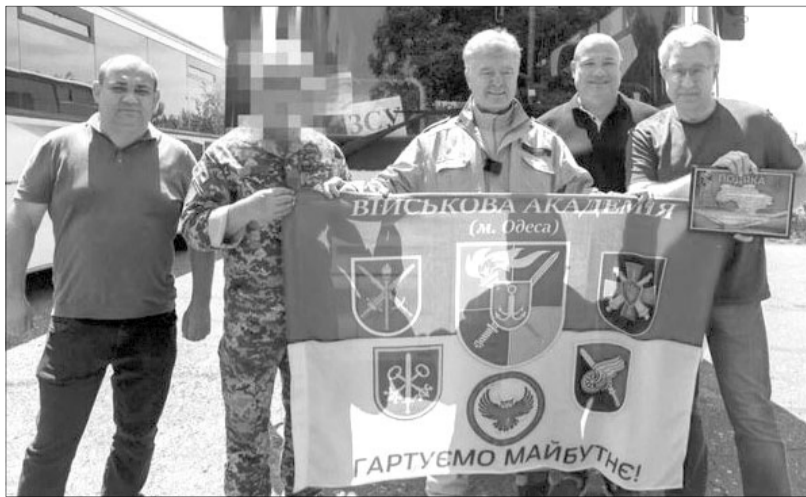
Цього разу морякам передали авторемонтну майстерню на базі вантажівки DAF, генератори і потужні зарядні станції.