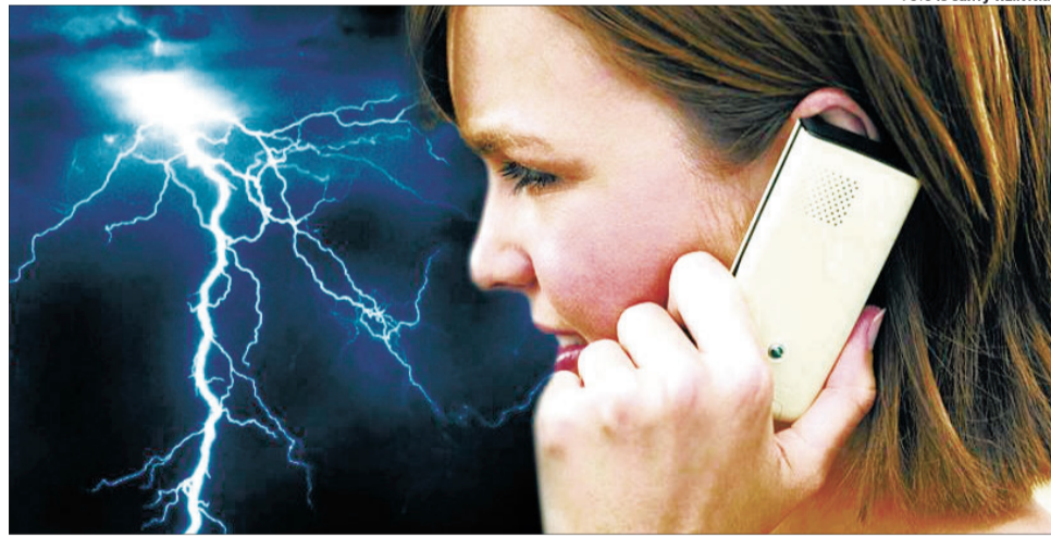
Під час грози негайно вимкніть мобільний телефон, адже він притягує електричний розряд.

1. Під час грози, якщо ви перебуваєте вдома, зачиніть всі вікна та двері, у приміщенні не повинні бути протягу: притягує кулю блискавки.