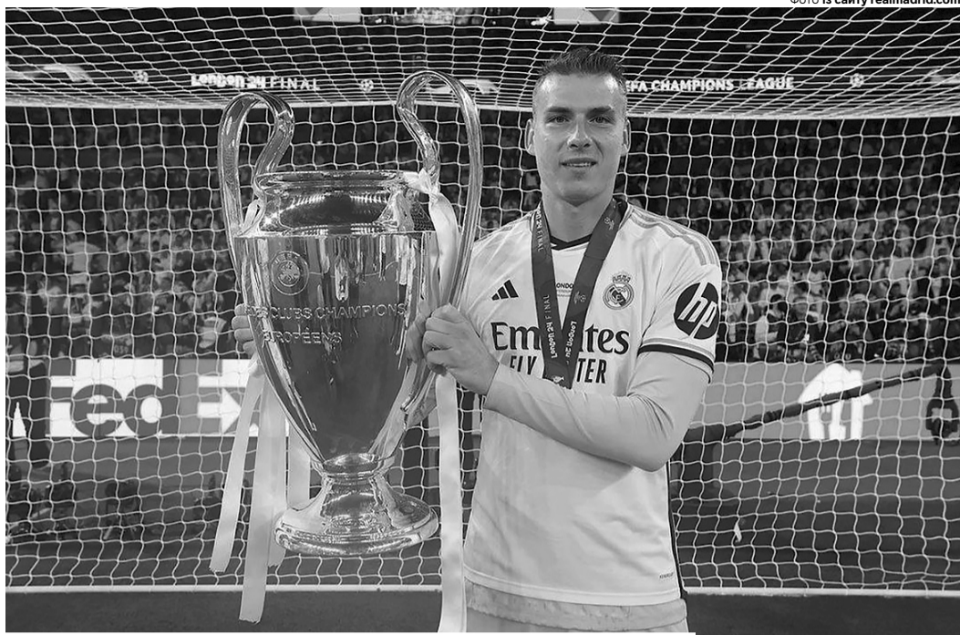
«Дякую вболівальникам «Реала» за підтримку та насагу. Що за сезон!»