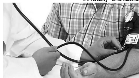
«Робочого» тиску не існує: якщо 140/90 мм рт. ст. і вищий – звертайтеся до лікаря!

Артеріальну гіпертензію не дарма називають «мовчазною убивцею». Людину нічого не турбує, тож вона думає, що все з нею гаразд. У цей час підвищений тиск методично «обробляє» її судини, серце й нирки. Органи працюють із додатковим навантаженням, і згодом це виливається у серйозні ускладнення – інсульт, інфаркт чи серцеву недостатність.