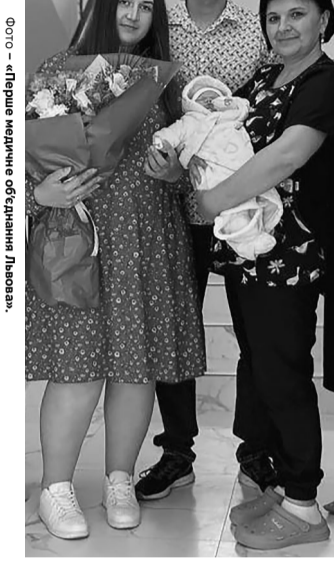
Щасливі батьки, забираючи Златочку додому, пообіцяли своєму лікарю невдовзі повернутися за... хлопчиком.