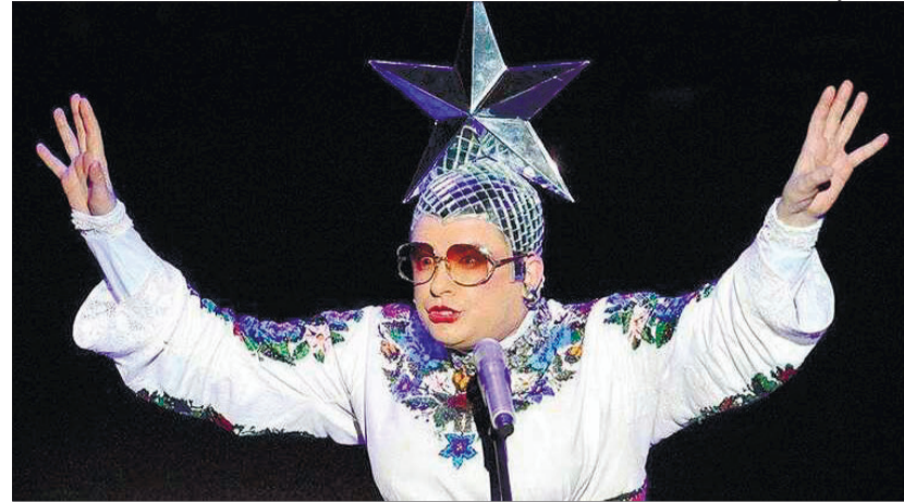
Фотоклаж із сайту bbc.com.