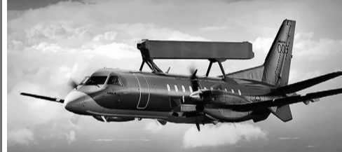
На вигляд – вражаючі. Але якби ж ці літаки прибули до нас швидко...